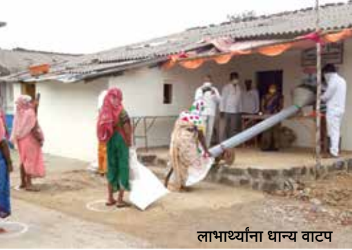
लाभार्थ्यांना धान्य वाटप

लॉकडाऊनच्या काळात नागरिकांना अन्नधान्याचा तुटवडा जाणवू नये, याची काळजी प्रशासनाने घेतली. अंत्योदय कुटुंब योजना, प्राधान्य कुटुंब आणि केशरी