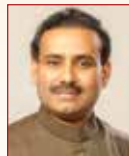
श्री. राजेश टोपे मा. मंत्री, सार्वजनिक आरोग्य व कुटुंब कल्याण