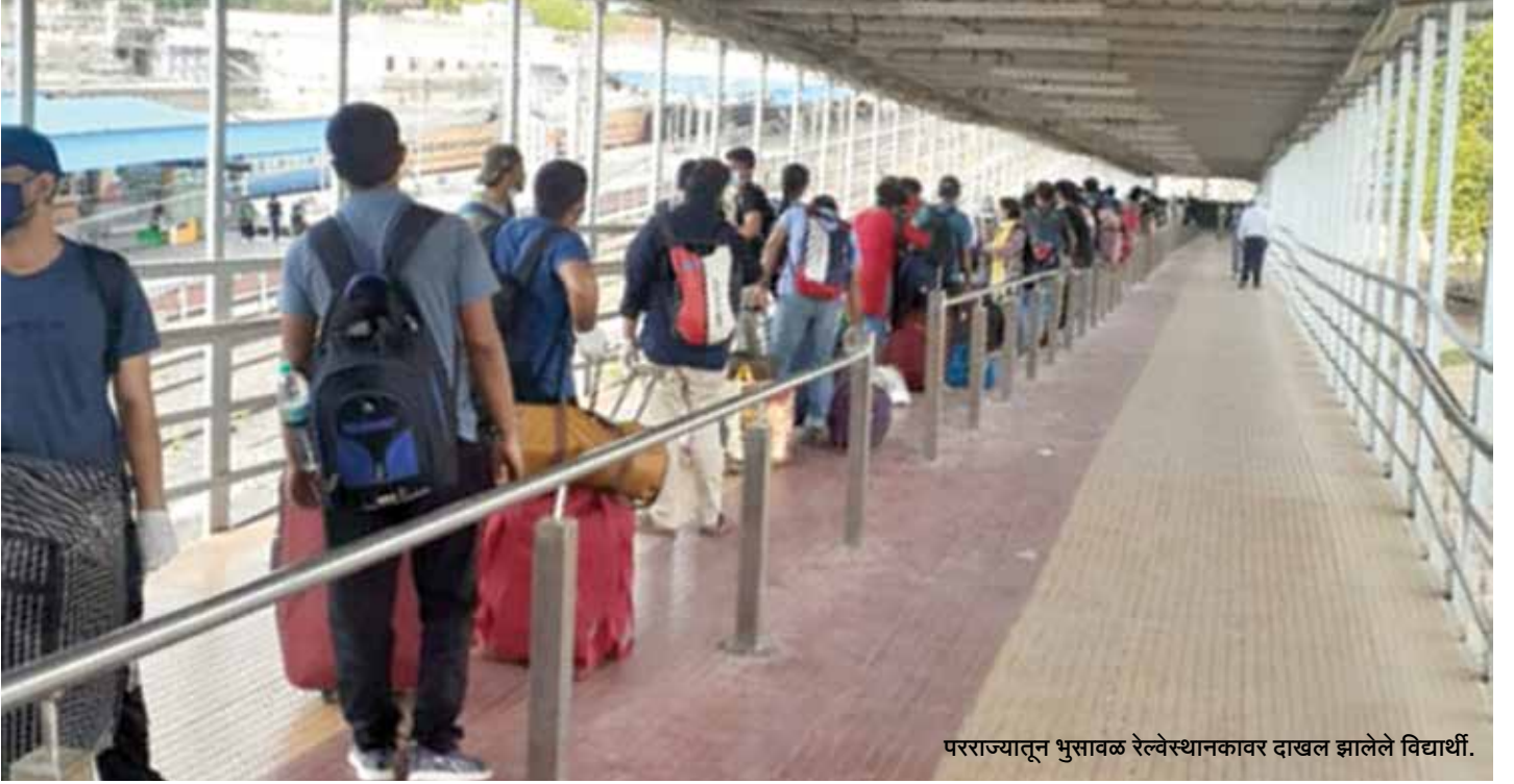
परराज्यातून भुसावळ रेल्वेस्थानकावर दाखल झालेले विद्यार्थी.

“ केंद्रीय लोकसेवा आयोगाच्या विविध परीक्षांचा अभ्यास करण्यासाठी दिल्ली येथे गेलेले राज्यातील हजारो विद्यार्थी लॉकडाऊनमध्ये अडकले होते, राजस्थानमधील कोटा येथे विविध अभ्यासक्रमांच्या प्रवेश परीक्षांच्या तयारीसाठी राज्यातून गेलेले सुमारे ८०० विद्यार्थी लॉकडाऊनपासून अडकून होते. तसेच तामिळनाडू राज्यात येरवड येथे रेल्वे विभागात प्रशिक्षण घेत असलेले मनमाड येथील १२ विद्यार्थी लॉकडाऊनमुळे अडकले होते. या सर्वाना राज्यात परत आणण्यात राज्य शासनाला यश आले. ”