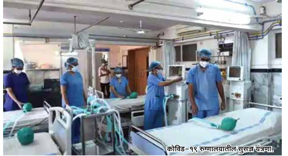
कोविड-१९ रुग्णालयातील सुसज्ज यंत्रणा.

आज :- १४८४ कोविड केअर सेंटर्स, २ लाख ४८ हजार ६०० बेड्स, ५७३ डेडिकेटेड कोविड हेल्थ सेंटर्स, २ लाख ४० हजार आयसोलेशन (ऑक्सिजनसह) उपलब्ध आहे आणि त्यात वाढच होत