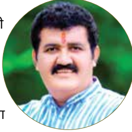
संजय राठोड वने मंत्री

झालेला आहे. तसेच काही ठिकाणी माणसांच्या हल्ल्यामध्ये किंवा इलेक्ट्रिक तारेचा स्पर्श झाल्यामुळे वन्यप्राण्यांचा मृत्यू झाल्याच्या घटना घडल्या आहेत. या पार्श्वभूमीवर वन्यजीव-मानव संघर्ष कमी करण्याच्या दृष्टीने तातडीच्या उपाययोजना करण्यात येत आहेत.