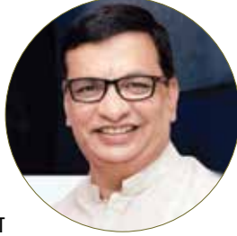
बाळासाहेब थोरात महसूल मंत्री

राज्य सरकारकडून दर वर्षी मार्च अखेरीस रेडीरेकनरचे दर जाहीर केले जातात. मात्र गेल्या काही दिवसांपासून महसूल विभागातील अधिकारी आणि कर्मचारी कोरोनाच्या संकटातून जनतेला सावरण्यासाठी झटत आहेत. त्यामुळे यावर्षीचे रेडीरेकनर दर जाहीर होणार