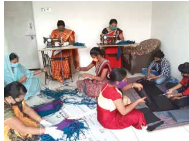
मास्कची निर्मिती करणाऱ्या बचत गटाच्या महिला.

जिल्हा परिषदेने सर्व बचत गटांना जास्तीत जास्त मास्कची निर्मिती करून ग्रामस्तरावर विक्री करण्याचे आवाहन केले. बचत गटांनीही सामाजिक दायित्व आणि रोजगाराची संधी म्हणून मोठ्या उमेदीने मास्क तयार करून त्याची विक्री