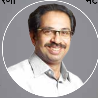
मा.श्री. उद्धव बाळासाहेब ठाकरे मुख्यमंत्री

दरवर्षी वारकरी दिंड्या पंढरपुरी जातात आणि पांडुरंगाचे दर्शन घेतात. पंढरीची वारी रद्द करताना मुख्यमंत्री म्हणून मला व मंत्रिमंडळातील माझ्या सहकाऱ्यांना खूपच विचार करावा लागला. या वर्षी कोरोनाच्या महाभयंकर संकटामुळे पालखी सोहळ्याच्या वाटचालीवर काही बंधने पडली. दिंड्या-पताका आणि वारकऱ्यांना सहभागी होता येणार नाही. याचे शल्य मलाही आहे. पण मी प्रत्येक वारकऱ्यात पांडुरंगाला पाहतो आहे.