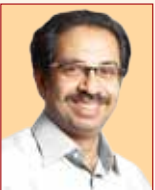
श्री. उद्धव ठाकरे मा. मुख्यमंत्री