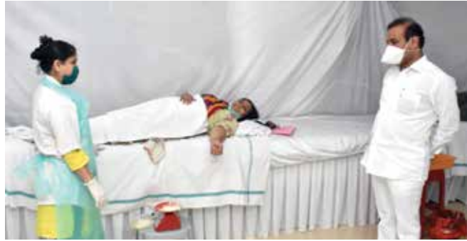
तत्पर रुग्णसेवेची खात्री करून घेताना आरोग्यमंत्री राजेश टोपे.

नर्स अन्य आरोग्य कर्मचारी यांचे मनोबल उंचावण्यासाठी त्यांना प्रोत्साहन देण्यासाठी आम्ही प्रयत्न करित आहोत. त्याची सुरुवात केली ती पुण्याच्या राष्ट्रीय विषाणू संस्थेला भेट देण्यापासून. या ठिकाणी काम करणाऱ्या तज्ज्ञांना मी भेटलो. त्यांच्या अडचणी जाणून घेतल्या. देशातील एकमेव असणारी ही संस्था आपल्या राज्यात कार्यरत आहे, त्याचा मला नक्कीच अभिमान आहे. मी पुण्याचे नायडू रुग्णालय, मुंबईच्या