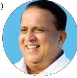
हसन मुश्रीफ ग्रामविकास मंत्री

राज्यामध्ये राष्ट्रीय महामार्गाचे काम अत्यंत संथ गतीने सुरू आहे. या महामार्गाच्या निर्मितीसाठी अनेक अडचणी येत आहेत, काही प्रश्न निर्माण झाले आहेत. हे प्रश्न सोडवण्यासाठी विभागीय आयुक्तांच्या अध्यक्षतेखाली एक समिती स्थापन करण्यात यावी व त्यासोबतच राज्यातील राष्ट्रीय महामार्गाचे काम जलद गतीने होण्यासाठी २० हजार कोटी रुपयांचा निधी केंद्र सरकारने राज्यातील