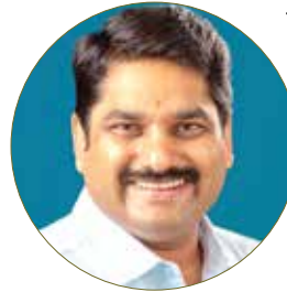
सतेज डी. पाटील माहिती तंत्रज्ञान राज्यमंत्री

सरकारने याबाबत पुढाकार घेऊन ही समस्या सोडवण्यासाठी धोरणात्मक निर्णय घ्यावा. कोरोनाच्या पार्श्वभूमीवर देशातील अनेक संशोधकांनी आर्टिफिशियल इंटेलिजन्स, रोबोटिक्स आणि हेल्थकेअर क्षेत्रात बरचे नवीन संशोधन केले आहे. या संशोधकांना किंवा संशोधन संस्थांच्या नवनवीन शोधांना मंजुरी देण्यासाठी तसेच ते प्रत्यक्षात वापरत