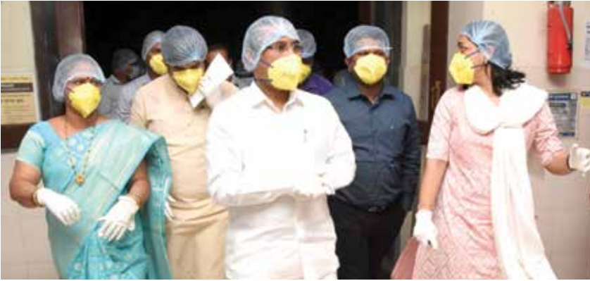
आरोग्य यंत्रणेचा प्रत्यक्ष आढावा घेताना आरोग्यमंत्री राजेश टोपे.

राज्यात रुग्णनिदान होण्यासाठी चाचण्यांची संख्या वाढविण्यावर सुरुवातीपासून भर देण्यात येत आहे. सुरुवातीला तीन ठिकाणी असलेली प्रयोगशाळांची संख्या वाढवत ती आता ७२ झाली आहे. त्यामुळे दररोज राज्यात १० हजारांहून अधिक चाचण्यांची क्षमता निर्माण झाली आहे.