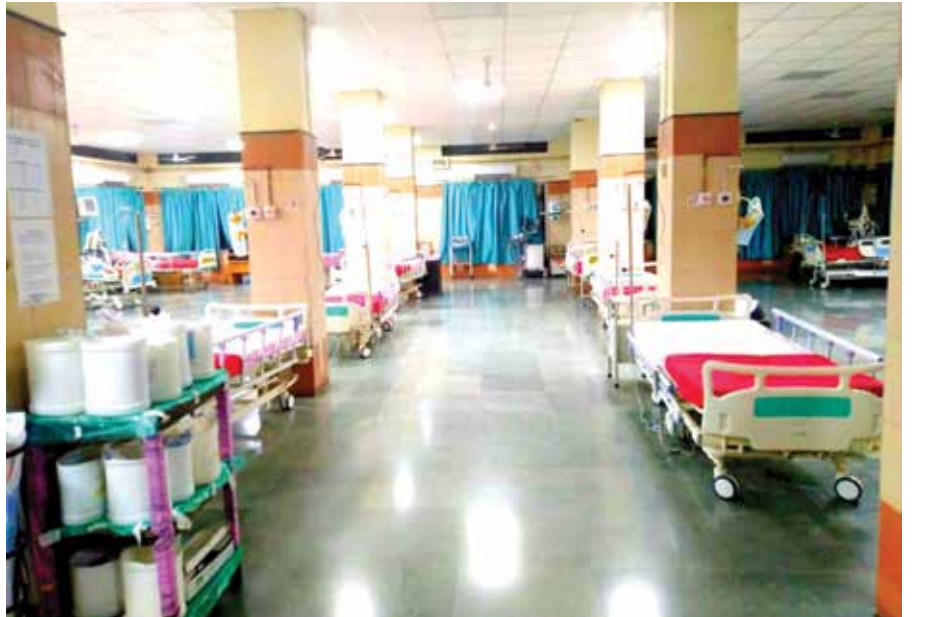
नागपूर येथील सुसज्ज कोविड केअर सेंटर.

झालेले १२८० खाटांचे कोविड हॉस्पिटल असो वा नागपूर महानगरपालिकेने एका आठवड्यात उभारलेले पाच हजार खाटांचे देशातील सर्वात मोठे ठरू शकणारे कोविड केअर सेंटर... याशिवाय तब्बल सहा हजारांच्या प्रशिक्षित वैद्यकीय मनुष्यबळाची उपलब्धता, स्थलांतरित मजुरांसाठी निर्मिलेली निवारणगृहे, पोलीस विभागाकडून सुरु असलेला अन्नछत्राचा उपक्रम, मजुरांसाठी सुरु झालेली रोजगार हमीची कामे, शिवभोजन थाळीच्या माध्यमातून गरजूंना मिळालेला दिलासा, नागपूर हेल्थ सर्व्हिलन्स अॅप, गोरगरिबांना धान्यवाटप, श्रमिकांना रेल्वेने दिलेला आधार, या कार्यवाहींचा वेळोवेळी घेतलेला आढावा, यामुळे आपत्ती निवारणाचा एक चांगला वस्तूपाठच नागपूर विभागाने घालून दिला