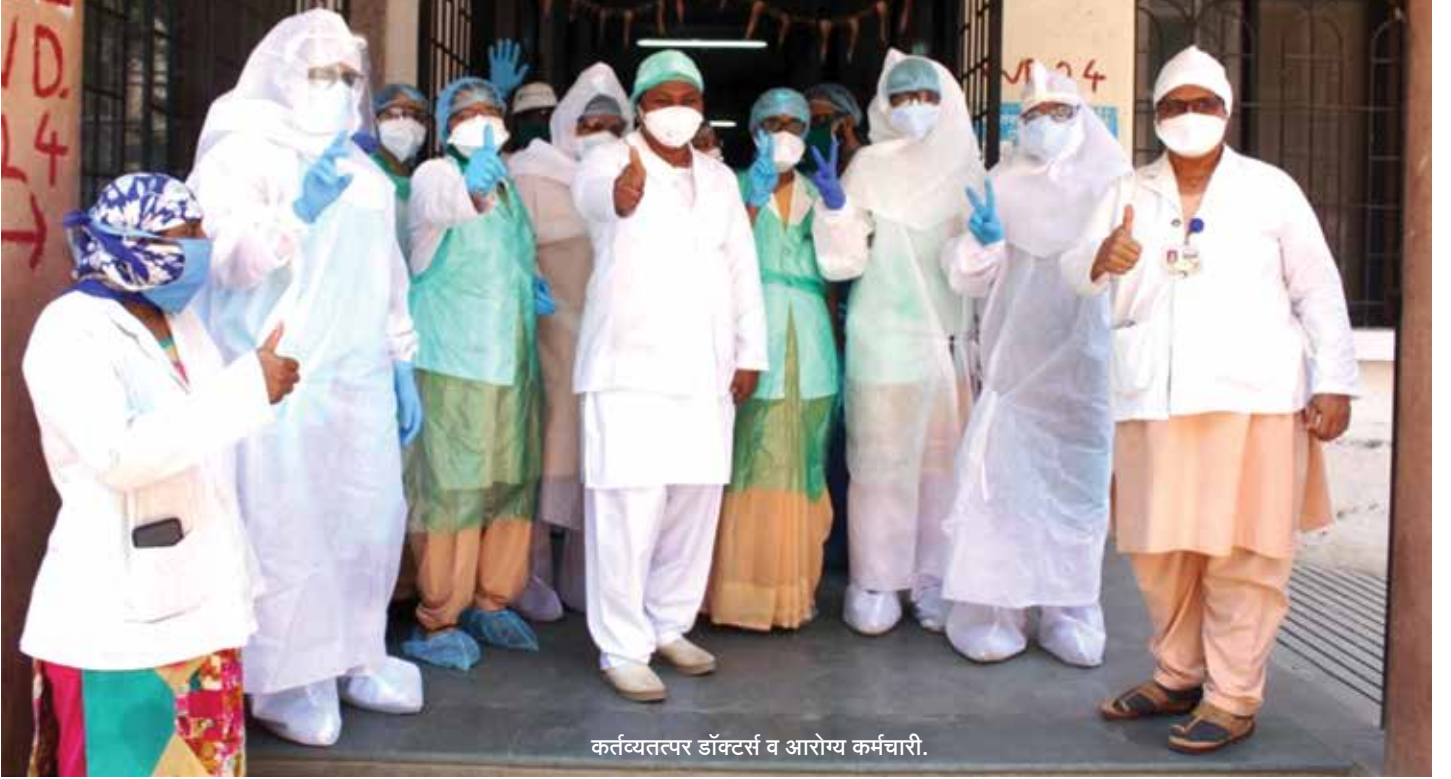
कर्तव्यतत्पर डॉक्टर्स व आरोग्य कर्मचारी.