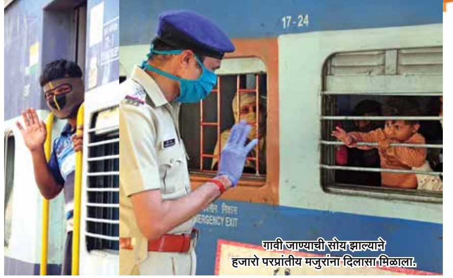
गावी जाण्याची सोय झाल्याने हजारां परप्रांतीय मजुरांना दिलासा मिळाला.

महाराष्ट्र औद्योगिक, आर्थिकदृष्ट्या प्रगत राज्य असल्याने देशभरातून आलेले लाखो मजूर बांधव आपल्या राज्यात काम करतात. लॉकडाऊनमुळे हे मजूर संकटात आले. अशा साडेसहा लाख परप्रांतीय मजुरांची राज्यात ठिकठिकाणी शिबिरांमध्ये व्यवस्था केली. तिथे दोन ते अडीच महिने त्यांच्या निवास, भोजन, वैद्यकीय उपचारांची सोय करण्यात आली. १६ लाखांहून अधिक मजुरांना त्यांच्या इच्छेनुसार रेल्वेने, एसटीने त्यांच्या राज्यात पोहोचवण्याची व्यवस्था केली. यासाठीचा खर्च राज्य शासनाने केला. कोरोनाविरुद्धच्या लढाईत महाराष्ट्राने माणुसकी कधी हरवू दिली नाही. देशवासीयांमधील ऋणानुबंध घट्ट करण्याचे काम केले, याचा आम्हाला अभिमान आहे.