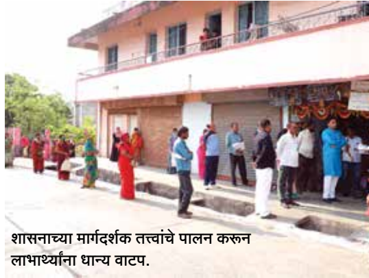
शासनाच्या मार्गदर्शक तत्वांचे पालन करून लाभार्थ्यांना धान्य वाटप.

लॉकडाऊनच्या कालावधीत जिल्ह्यातील नागरिक उपाशी राहू नये याकरिता अन्नधान्य पुरवठा विभागामार्फत विविध उपाययोजना करण्यात आल्या. जिल्ह्यातील ३१ हजार १२ शिधापत्रिकाधारकांना सोशल डिस्टन्सिंगचे पालन करून १८ हजार ८३ मेट्रिक टन अन्नधान्याचे वितरण करण्यात आले. कोरोना विषाणूच्या प्रादुर्भावामुळे लॉकडाऊन सुरु असल्याने गरजू व्यक्तींच्या उदरनिर्वाहाचा प्रश्न सोडवण्यासाठी राज्य शासनाने सुरु केलेली शिवभोजन योजना