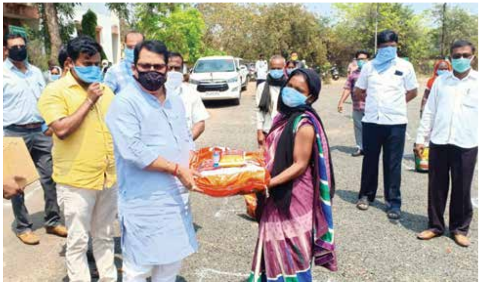
गरजूंना आवश्यक साहित्याचे वाटप करताना मदत व पुनर्वसन मंत्री विजय वडेटीवार.