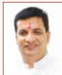
श्री. बाळासाहेब थोरात मा. महसूल मंत्री