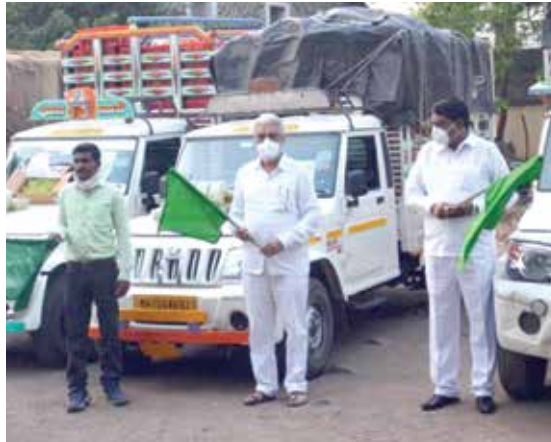
शेतमालाची थेट विक्री करणाऱ्या वाहनांना हिरवी झेंडी दाखवताना कृषिमंत्री दादाजी भुसे व इतर मान्यवर.

कृषी यंत्रणेला खरीपासाठी अधिक प्रयत्न करण्याच्या सूचना दिल्या. विविध कृषी विद्यापीठांच्या माध्यमातून शेतकऱ्यांचे ऑनलाइन प्रशिक्षण वर्गदिखील या काळात घेण्यात आले.