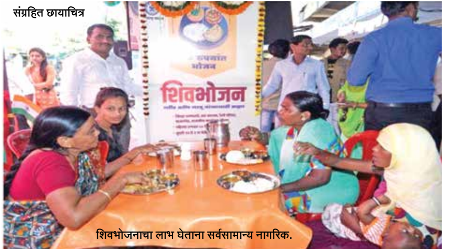
शिवभोजनाचा लाभ घेताना सर्वसामान्य नागरिक.