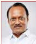
श्री. अजित पवार मा. उपमुख्यमंत्री