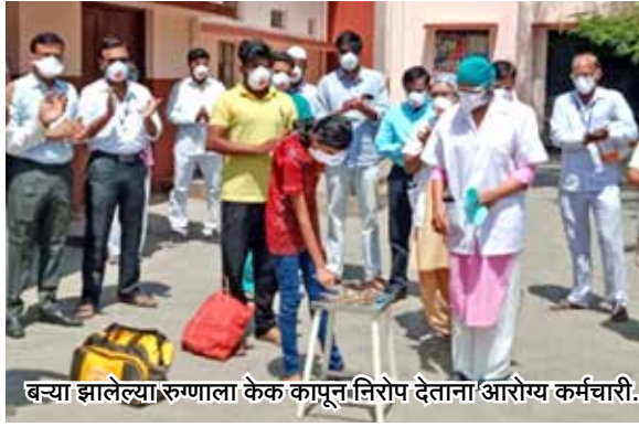
बऱ्या झालेल्या रुग्णाला केक कापून निरोप देताना आरोग्य कर्मचारी.

औरंगाबाद विभागात औरंगाबाद, जालना, बीड आणि परभणी जिल्ह्यात कोरोना विषाणूचा प्रसार रोखण्यासाठी आणि कोरोनामुक्त रुग्णांचे प्रमाण वाढवण्यासाठी जिल्हा प्रशासन, जिल्हा रुग्णालय आणि महानगरपालिका आरोग्य विभाग यांच्यामार्फत विविध उपाययोजना करण्यात येत आहेत. या यंत्रणांच्या प्रयत्नांमुळे कोरोना रुग्ण बरे होण्याचे प्रमाणही या विभागात जास्त आहे. कोरोना विषाणूचा संसर्ग