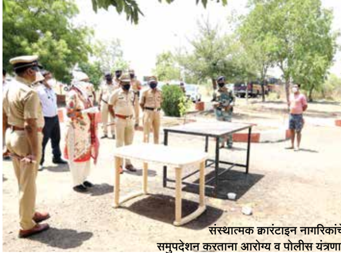
संस्थात्मक क्वारंटाइन नागरिकांचे समुपदेशन करताना आरोग्य व पोलीस यंत्रणा.

लातूर जिल्ह्यात एकूण ३० कंटेन्मेंट झोन होते. त्यापैकी ४ कंटेन्मेंट झोन बंद करण्यात आले आहेत. कंटेन्मेंट झोन निर्धारित केलेल्या भागात त्या भागातील १०० घरातील प्रमुख, प्रतिनिधी यांचा व्हॉट्सअप ग्रुप तयार करण्यात आला आहे. या ग्रुपमध्ये कॉमन अधिकारी म्हणून जिल्हाधिकारी, उपविभागीय अधिकारी, तहसीलदार, पोलीस निरीक्षक, गटविकास अधिकारी, नगर परिषद, नगर पंचायतचे मुख्याधिकारी, तालुका आरोग्य अधिकारी, वैद्यकीय अधीक्षक, अत्यावश्यक सेवा घरपोच पुरवण्यासाठी सेवानिहाय चार अधिकारी (उदा. औषधी पुरवठा, पाणीपुरवठा, किराणा व दूध, भाजीपाला व फळे) हे अधिकारी या ग्रुपमध्ये असणार