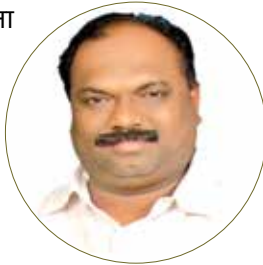
अॅड. अनिल परब परिवहन मंत्री

राज्य शासन एसटी महामंडळाच्या माध्यमातून सुमारे २७ विविध सामाजिक घटकांना ३३ टक्के ते १०० टक्क्यांपर्यंत प्रवासी भाड्यामध्ये सवलत देते. या सवलत योजनेचा लाभ घेण्यासाठी संबंधित लाभार्थींना आधार क्रमांकाशी निगडित असलेल्या स्मार्ट कार्ड काढण्याची योजना एसटीने यापूर्वीच सुरू केली आहे. त्यानुसार एसटीच्या प्रत्येक आगारामध्ये ज्येष्ठ नागरिक व अन्य सवलत धारकांना स्मार्ट कार्ड देण्याची प्रक्रिया सुरू आहे. परंतु कोरोना विषाणूच्या पार्श्वभूमीवर सध्या अनेक प्रवाशांना आगारात येऊन स्मार्ट कार्ड घेणे शक्य नसल्याने तसेच