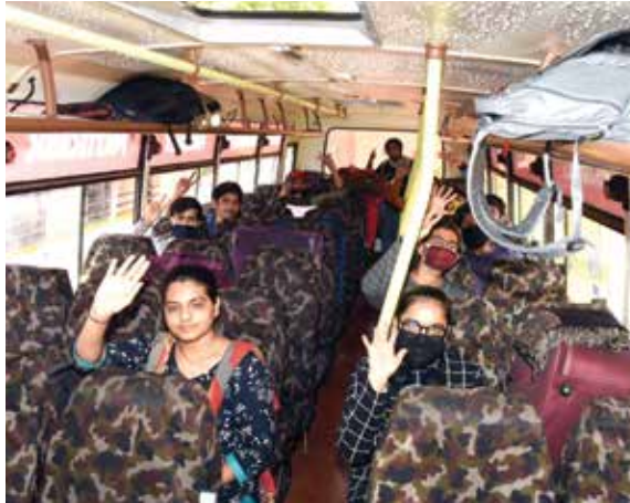
परराज्यातून बसने स्वगृही परतलेले विद्यार्थी.