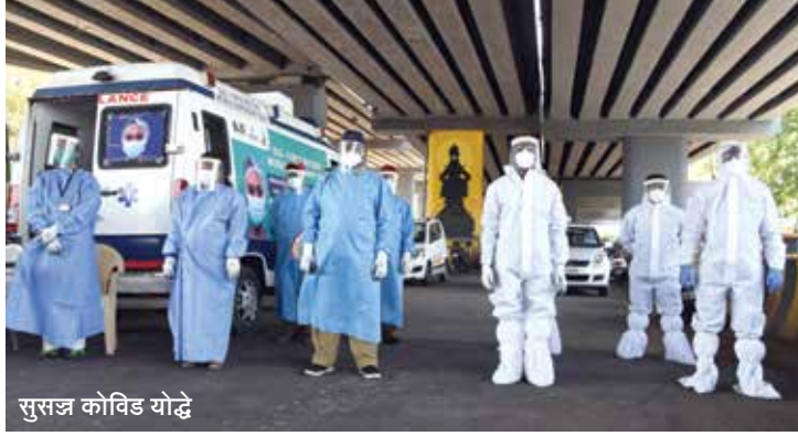
सुसज्ज कोविड योद्धे