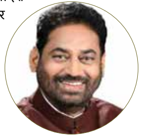
डॉ. नितीन राऊत ऊर्जा मंत्री

ग्राहकांशी रोजचा होणारा संपर्क टाळण्याच्या सूचना दिल्या आहेत. मीटर रीडिंग करण्यासाठी व बिलाचे वितरण करण्यासाठी ग्राहकांच्या घरी २३ मार्चपासून पुढील आदेश येईपर्यंत जाऊ नये. या काळात मीटर रीडिंग न झाल्यामुळे ग्राहकांना सरासरी बिल पाठवण्याची सूचना देण्यात आल्या आहेत. या काळात वीज बिलाची छपाई करण्यात येणार नाही. तथापि महावितरणच्या संकेतस्थळावर बिले उपलब्ध करून देण्यात येणार आहेत. सोबतच ग्राहकांनी महावितरणकडे नोंदविलेल्या मोबाइल नंबरवर