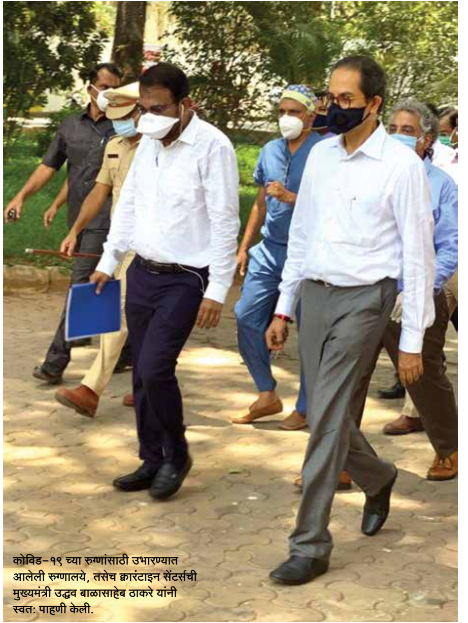
कोविड-१९ च्या रुग्णांसाठी उभारण्यात आलेली रुग्णालये, तसेच क्वारंटाइन सेंटर्सची मुख्यमंत्री उद्धव बाळासाहेब ठाकरे यांनी स्वतः पाहणी केली.