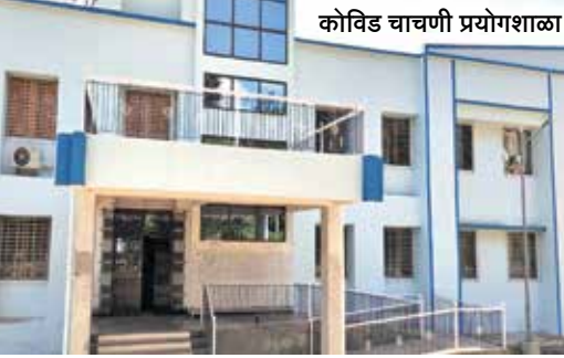
कोविड चाचणी प्रयोगशाळा

या पूर्वी पालघर जिल्ह्यातील कोरोना संशयित रुग्णांची घशातील स्वॅब टेस्टिंग मुंबई येथे करण्यात येत होती. हे अहवाल प्राप्त होण्यासाठी किमान ३ ते ४ दिवसांचा कालावधी लागत होता. आता जिल्ह्यातच ही चाचणी लॅब सुरू झाल्याने प्रशासनास जास्तीत जास्त चाचण्या करणे शक्य होणार आहे आणि कोरोना चाचणी अहवालास गती मिळणार असल्याने निदान झालेल्या पॉझिटिव्ह कोरोना रुग्णांवर तातडीने उपचार करणे शक्य होणार आहे. डहाणू येथील कॉटेज हॉस्पिटलच्या