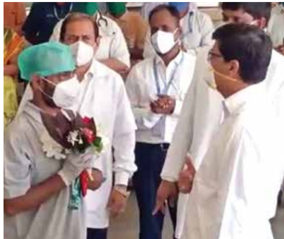
आरोग्य यंत्रणेचे आभार व्यक्त करताना कोरोनामुक्त झालेली व्यक्ती.

कोरोनाविरुद्धची लढाई ही सर्वांनी आपापली काळजी घेऊन जिंकायची आहे. कोरोनाचा संसर्ग स्वतःला होऊ न देणे व झाल्यास दुसऱ्याला त्याचा प्रादुर्भाव होऊ न देणे ही प्रत्येकाची जबाबदारी आहे. त्यातूनही जर कोरोनाचा संसर्ग झाल्यास, राज्यातील समस्त १२ कोटी जनतेचे कोरोनावरील उपचार महात्मा फुले जनआरोग्य योजनेतर्गत एक हजार रुग्णालयांमध्ये मोफत करण्याची सोय राज्य शासनाने उपलब्ध केली आहे. खासगी रुग्णालयातील ८० टक्के खाटा शासनाकडून अधिग्रहित करण्यात आल्या असून तिथे रुग्णांना