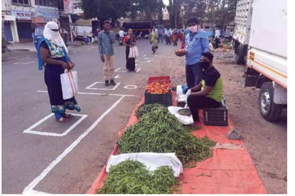
शेतकऱ्यांना थेट मालविक्रीची मुभा.

कोरोनाविरुद्धची लढाई लढत असताना समाजातील शेतकरी, कष्टकरी, दुर्बल, वंचित घटकांची संपूर्ण काळजी राज्य शासनाने घेतली. कृषी क्षेत्राचे महत्त्व लक्षात घेऊन या क्षेत्राला सुरुवातीपासूनच निर्बंधातून मोकळीक दिली. दूध उत्पादक शेतकऱ्यांचे नुकसान टाळण्यासाठी त्यांच्याकडील दूधाची दोन महिने खरेदी करून या कालावधीत चार कोटी लिटर दुधाचे पावडरमध्ये रूपांतर करण्यास मान्यता देण्यात आली. यासाठी १२७ कोटी रुपयांचा निधी शासनाने उपलब्ध करून दिला. महात्मा जोतीराव फुले कर्जमुक्ती योजनेतील पात्र लाभार्थींच्या अंतिम यादीत नाव असलेल्या परंतु कोरोना संकटामुळे कर्जमुक्तीचा लाभ न मिळालेल्या शेतकऱ्यांना ते थकबाकीदार असल्याने नवीन कर्ज मिळत नव्हते. राज्य शासनाने यासंदर्भात पुढाकार घेऊन रिझर्व्ह बँकेला पत्र दिले व अशा सर्व शेतकऱ्यांचे कर्ज माफ करण्यात येणार असल्यामुळे त्यांना खरीप हंगामासाठी कर्ज द्यावे, अशी विनंती केली आहे, तसेच कर्जाची रक्कम राज्य शासनाकडून