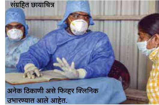
अनेक ठिकाणी असे फिव्हर क्लिनिक उभारण्यात आले आहेत.

अमरावती विभागातील पाच जिल्ह्यांपैकी वाशिम जिल्ह्यात आतापर्यंत सर्वात कमी संसर्ग झाला. जिल्ह्याच्या सीमेवरील चेक पोस्टवरच आरोग्य तपासणी होत असल्याने जिल्ह्यात कोरोनाला 'ब्रेक' लागला. आतापर्यंत सुमारे ३५ हजारांवर नागरिकांची तपासणी झाली. या चेक पोस्टवरूनच ८ कोरोनाबाधित व्यक्तींना