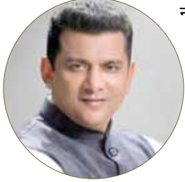
अस्लम शेख बंदर विकास मंत्री

व्यापार सुरळीत चालण्यासाठी जहाजावरून माल वाहतूक करण्यापूर्वी किंवा माल आल्यानंतर कंटेनर ठेवण्यासाठी (कंटेनर फ्रेट स्टेशन (सीएफएफ)) देण्यात येणारी