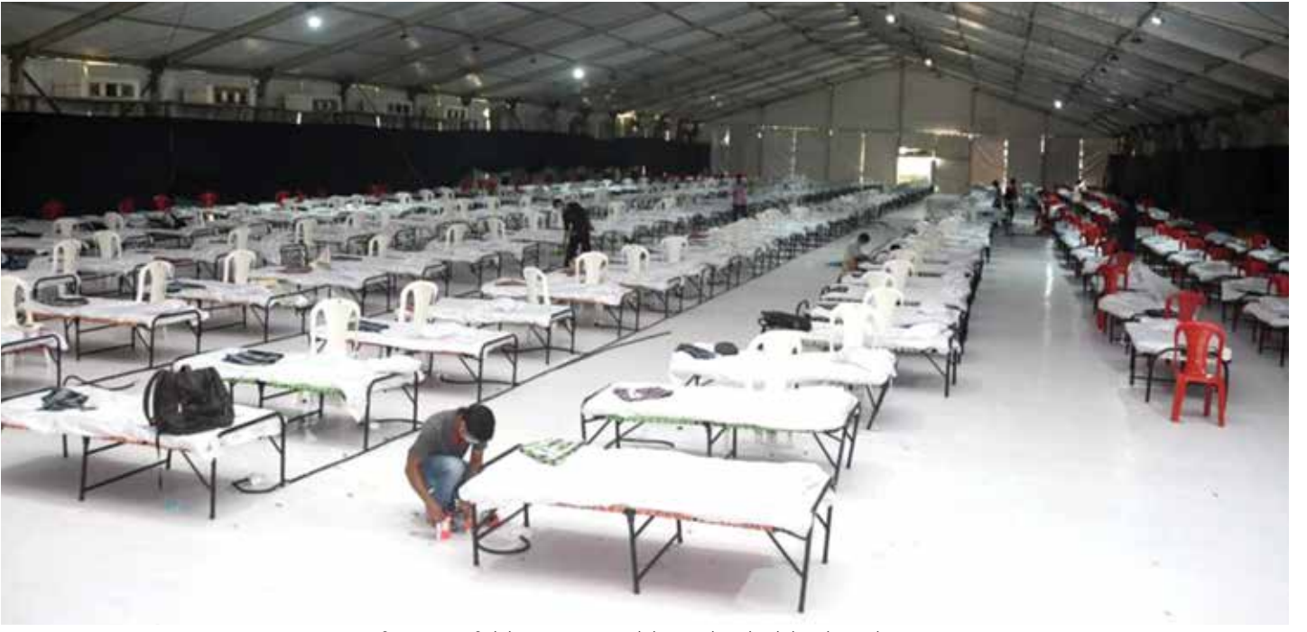
मुंबईतील महालक्ष्मी येथे उभारण्यात आलेले ६०० बेड्सचे कोरोना केअर सेंटर.

“ राज्य शासन कोरोनाचा समर्थपणे मुकाबला करत आहे. कोरोनाबाबत आपल्या राज्याने आधीच खबरदारी घेऊन अनेक उपाययोजना केल्या. त्यामुळे आज राज्यात देशातील सर्वाधिक रुग्ण आपल्याकडे आढळत असतानाही आपण समर्थपणे या समस्येला तोंड देत आहोत. राज्याचा रुग्ण दुपटीचा दर हा १४ दिवसांवर आला आहे. राज्य शासनाने वेळोवेळी केलेल्या उपाययोजनांमुळे हे शक्य होत आहे. रुग्ण वाढताहेत तसे बरे होणाऱ्या रुग्णांचीही संख्या दिवसेंदिवस वाढत आहे. राज्यात दररोज एक हजारच्या आसपास रुग्ण बरे होऊन घरी जात आहेत. ”