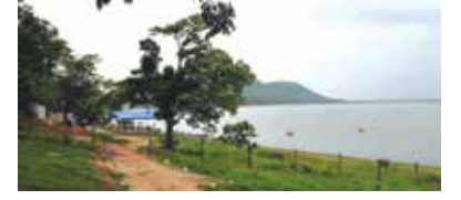
तृप्त करणारी भूमी ३८

विदर्भाची भूमी पर्यटकांना तृप्त करून टाकणारी आहे. व्याघ्र प्रकल्पांसोबतच नैसर्गिक, ऐतिहासिक, धार्मिक व सामाजिक स्थळांचा मोठा वारसा या भूमिल्या लाभला आहे.