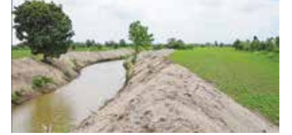
प्रेरणादायी प्रयोग ५६

महाराष्ट्रात पावसाची अनियमितता आणि पडलेल्या पाण्याच्या योग्य नियोजनाअभावी बिकट परिस्थिती निर्माण झाली होती. यावर रचनात्मक उपाययोजना म्हणून जलयुक्त शिवार अभियान प्रभावीपणे राबवण्यात आले.