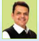
श्री. देवेंद्र फडणवीस मा. मुख्यमंत्री

महावितरणच्या थकबाकी असलेल्या कृषीपंप धारक ग्राहकांसाठी