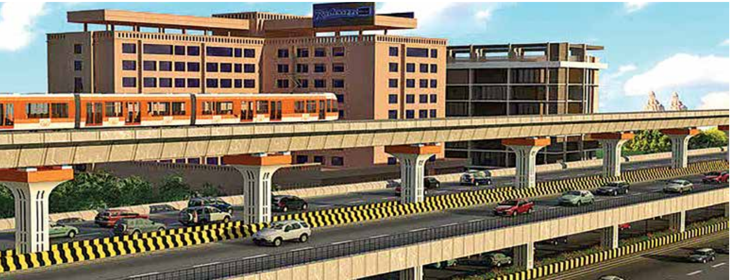
नागपूर मेट्रोसाठी तयार होत असलेल्या डबर डेकर पुलाचे संकल्प चित्र.