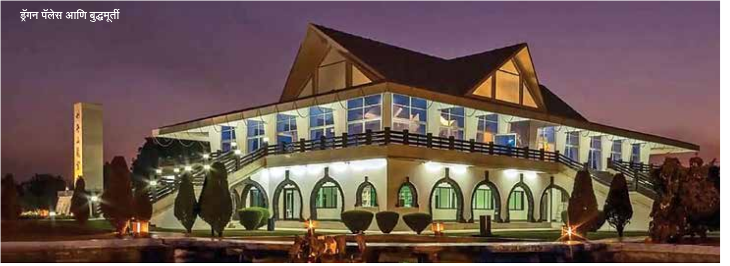
ड्रॅगन पॅलेस आणि बुद्धमूर्ती

पूर्वेकडे ७४ किलोमीटर अंतरावर वैनगंगेच्या काठावर वसले आहे अंभोरा. तिथे चैत्यनेश्वराचे मंदिर आहे. याच ठिकाणी संत हरहरस्वामी यांची समाधी आहे. गोसेखुर्द धरणाचा परिसर या जागेला लागूनच आहे. बॅकवॉटर अंभोऱ्यापर्यंत आल्याने नौकायनासाठी हे आकर्षणाचे केंद्र झाले आहे.