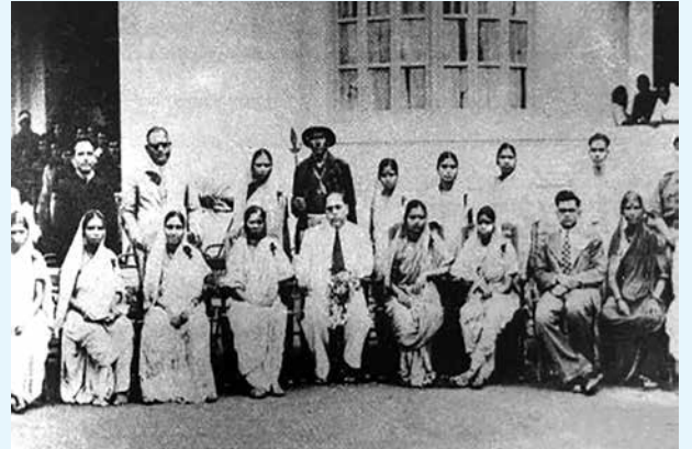
अखिल भारतीय अस्पृश्य महिला परिषद, नागपूर (१९४२)

स्त्रियांचे उद्धारक भारतात पुष्कळ झाले. परंतु कैवारी मात्र एकच झाला. डॉ. बाबासाहेब आंबेडकर माता रमाईना पाठवलेल्या एका पत्रात त्यांनी स्त्रियांच्या प्रगती व मुक्तीसाठी संघर्ष करणारा मी योद्धा आहे, असे म्हटले आहे. ते सर्वार्थाने सत्य आहे. दोन्ही हाती शस्त्र घेऊन, महिलांच्या हक्कासाठी संघर्ष करणारा असा योद्धा पुन्हा होणे नाही. कायद्याचे शस्त्र एका हाती तर चळवळीचे शस्त्र दुसऱ्या हाती सर्व भारतीय महिलांनी मानले पाहिजे. आपल्या ६५ वर्षांच्या उण्यापुऱ्या आयुष्यात लढणाऱ्या योद्ध्याने राजकीय, सामाजिक, आर्थिक व धार्मिक अशी चारही शस्त्रे पादाक्रांत केली. परंतु या पराक्रमाला जोड होती करुणेची, महिला आणि शूद्रादी प्रजेवर पराकोटीच्या जातीय व्यवस्थेने केलेल्या अन्याय अत्याचाराचा राग व त्या पिळवणुकीला बळी पडलेल्यांविषयी करुणा, यातून बाबासाहेबांनी या देशात सामाजिक क्रांती केली. तथागत बुद्धाने केलेल्या क्रांतीनंतर ही दुसरी महत्त्वाची सामाजिक क्रांती होय. सर्व प्रकारच्या विषमतेपैकी एक म्हणजे स्त्री-पुरुष विषमता. त्यामुळे डॉ. बाबासाहेब आंबेडकरांनी स्त्रियांवर होणारे अन्याय दूर करण्यासाठी वापरलेले महत्त्वाचे अस्त्र म्हणजे कायदा. स्वतःचे सर्व