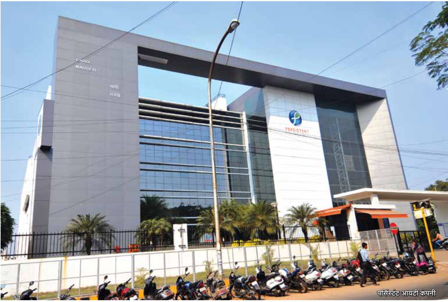
पर्सिस्टंट आयटी कंपनी

संसाधन संपन्न असलेले नागपूर माहिती तंत्रज्ञानाच्या क्षेत्रात स्वतःचे स्थान निर्माण करण्यासाठी पुढे सरसावले आहे. नागपूर आणि आसपासच्या भागात माहिती तंत्रज्ञानाशी संबंधित अनेक कंपन्या स्थापन झाल्या आहेत. गेल्या काही काळात माहिती तंत्रज्ञानातील उद्योजकता वाढलेली आहे. विदेशी गुंतवणूकदारांसोबत काम करणाऱ्या अनेक सॉफ्टवेअर विकासक कंपन्या माहिती तंत्रज्ञान सेवा पुरवठादार मोबाइल फोनसाठी गेम्स विकासक यांची भरभराट होत आहे. भविष्यातील महत्त्वाचे माहिती तंत्रज्ञानाचे तळ (आयटी हब) म्हणून हे शहर विकसित होत आहे.