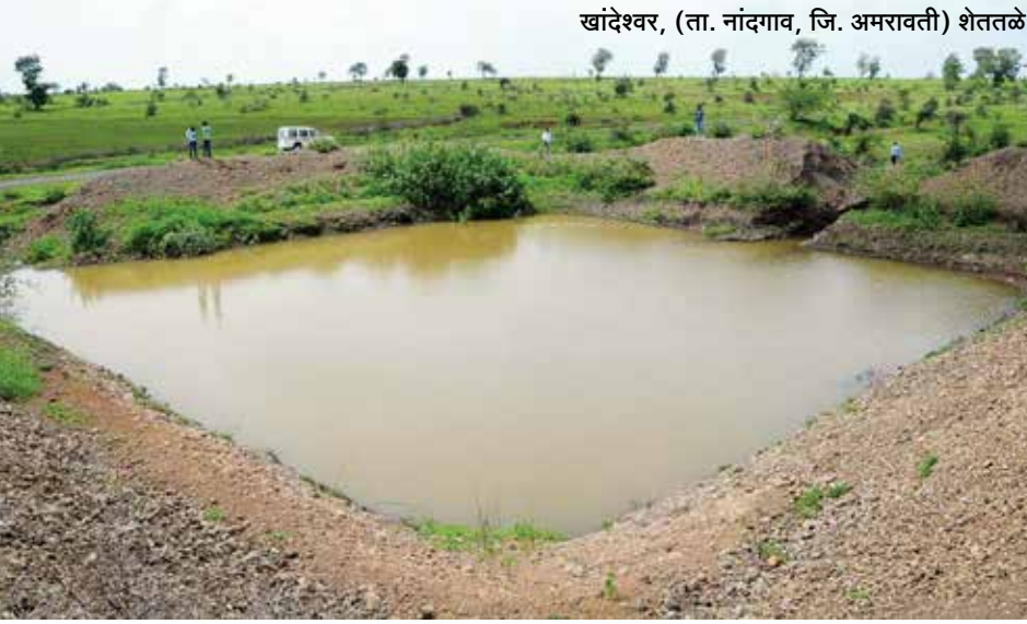
खांदेश्वर, (ता. नांदगाव, जि. अमरावती) शेततळे

यवतमाळ जिल्ह्यातील ५८ गावे ही बारमाही टँकरने पाणी पुरवठा करावी लागणारी होती. या गावांमध्ये जलयुक्त शिवार कटाक्षाने राबवण्याच्या निर्णयानंतर गेल्या दोन वर्षांमध्ये येथील चित्र कमालीचे पालटले आहे. यातील ४६ गावे टँकरमुक्त झाली आहेत.