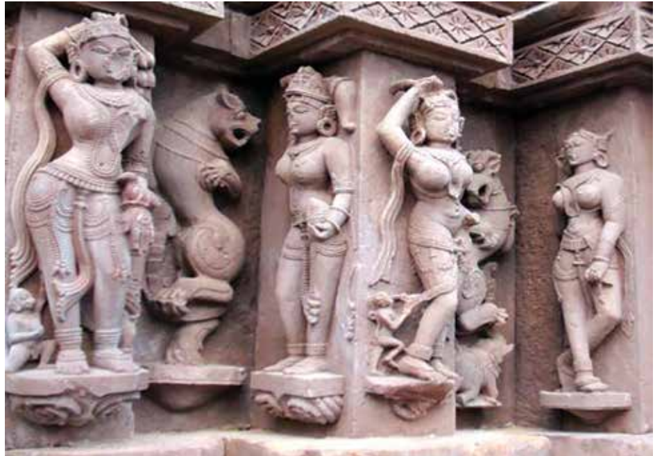
मार्कंडा शिवमंदिर आणि त्यावरील अप्रतिम शिल्पे.