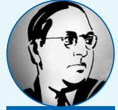
महापरिनिर्वाण दिन विशेष

बालभीमाने प्रमेय अचूक सोडवले आणि ते शिक्षक अतिशय प्रसन्न झाले. कोण होत ते शिक्षक? ते शिक्षक म्हणजे मराठी साहित्यातील ख्यातनाम कांदबरीकार वामन मल्हार जोशी यांचे ते बंधू होतेच पण हेच शिक्षक म्हणजे पुढे भारतातले महत्त्वाचे कम्युनिस्ट नेते ना. म.जोशी हे होत. म्हणूनच ह्या ना. म. जोशी ह्यांच्याबद्दल बाबासाहेबांच्या मनात आदर होता आणि त्यांचे पी.ए. असणारे स्वामीजी ह्यांच्याबद्दल नेहूरू व सरदार ह्यांच्या मनात एक बारीक अशी अढी होती, त्याचेही कारण हेच होते.