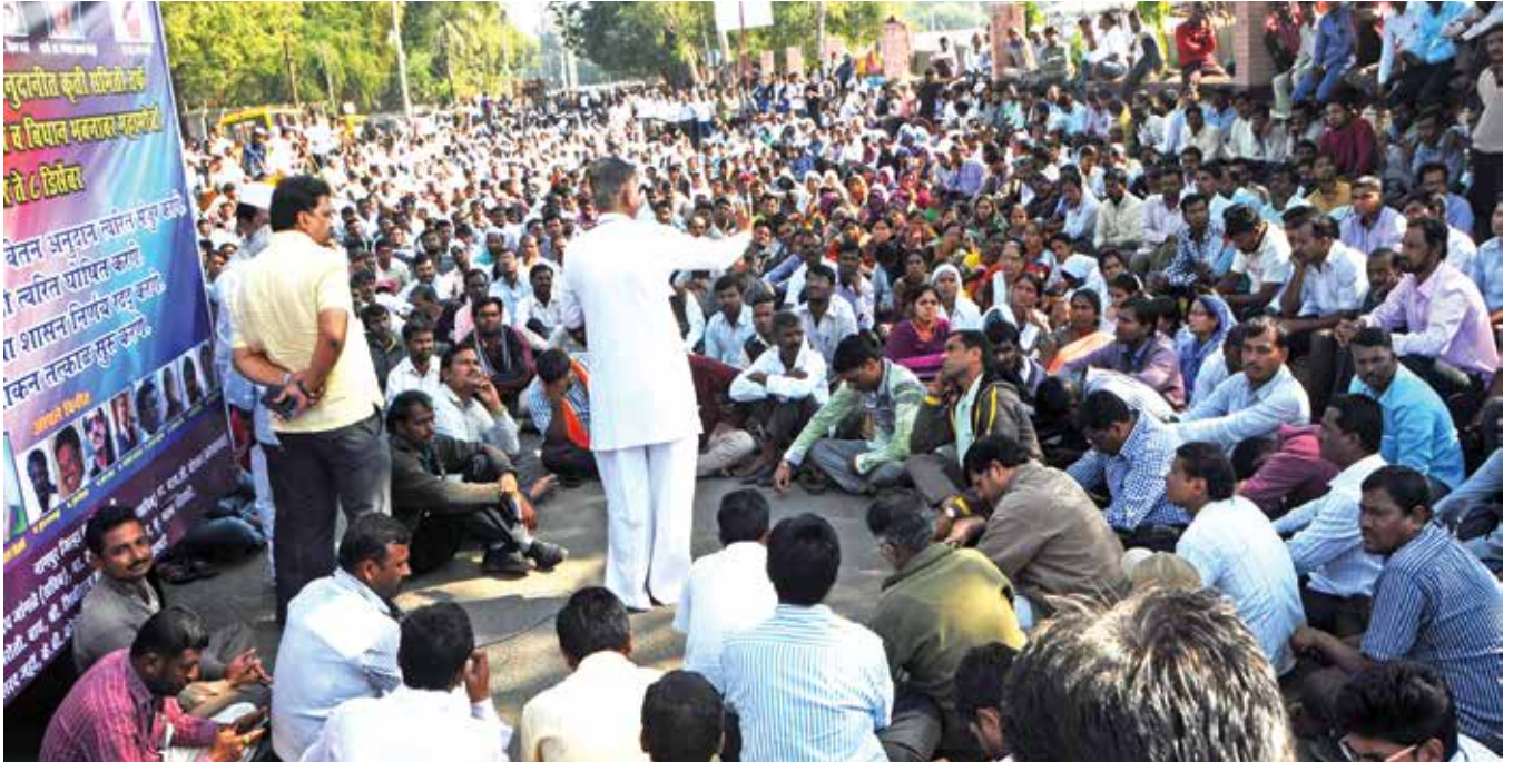
मोर्चाशिवाय अधिवेशन नाही..