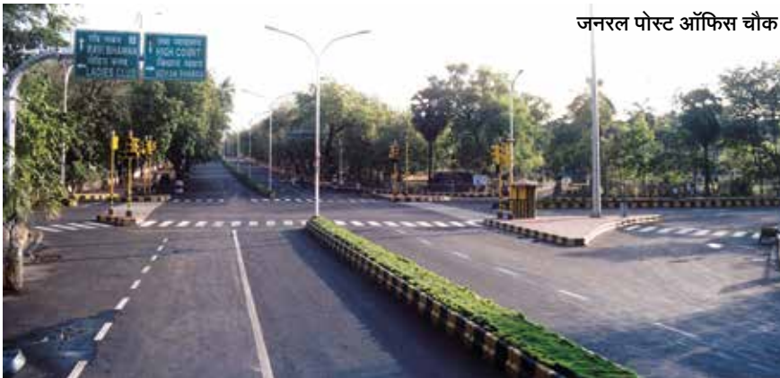
जनरल पोस्ट ऑफिस चौक

सुरू असलेल्या विविध प्रकल्पांची पाहणी केली. एप्रिल महिन्यात नागपूरने पुढाकार घेऊन, 'स्मार्ट सिटी समीट'चे आयोजन केले होते. यात स्मार्ट सिटीमध्ये निवड झालेल्या देशांतील विविध शहरांतील महापौर व आयुक्तांना आमंत्रित करण्यात आले होते. यात सहभागी झालेल्या महापौर आणि आयुक्तांनी नागपुरातील प्रकल्पांची पाहणी करून, समाधान व्यक्त केले. 'नागपूर पॅटर्न'ने त्यांच्या शहरात कार्य करण्याची तयारी त्यांनी दर्शवली.