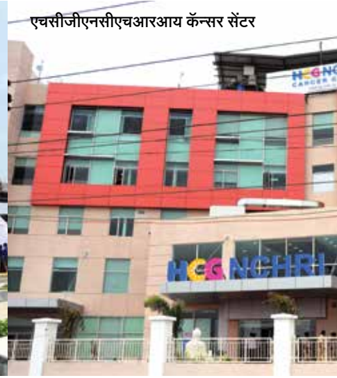
नॅशनल कॅन्सर इन्स्टिट्यूट, नागपूर