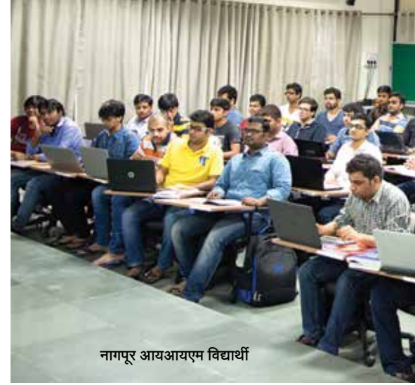
नागपूर आयआयएम विद्यार्थी