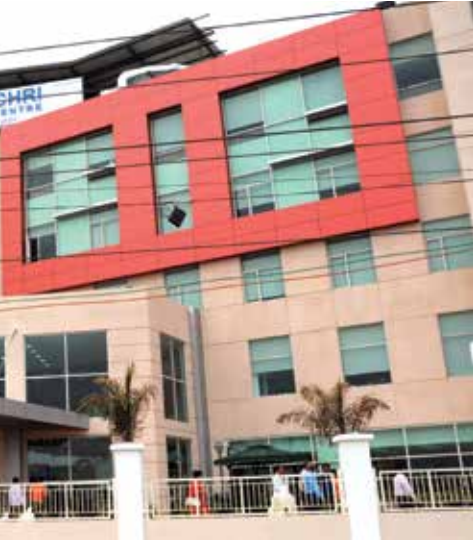
नागपूर येथील शासकीय वैद्यकीय महाविद्यालय

संस्था कार्यरत आहेत. आयुष'च्या माध्यमातून शासकीय आयुर्वेद महाविद्यालय व रुग्णालयाचे बळकटीकरण करून, यांच्या सहकार्यातून 'आयुर्वेद उद्यान' तयार करण्यात येत आहे. गडचिरोली येथे हे वनौषधीचे भांडार आयुर्वेद उद्यानातून उभारले जाईल.