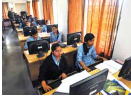
'इंडियाज् हार्ट, नागपूर स्मार्ट' १९

संसाधन संपन्न असलेले नागपूर माहिती तंत्रज्ञानाच्या क्षेत्रात स्वतःचे स्थान निर्माण करण्यासाठी पुढे सरसावले आहे. नागपूर आणि आसपासच्या भागात माहिती तंत्रज्ञानाशी संबंधित अनेक कंपन्या स्थापन झाल्या आहेत. गेल्या काही काळात माहिती तंत्रज्ञानातील उद्योजकता वाढलेली आहे.