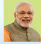
श्री. नरेंद्र मोदी मा. प्रधानमंत्री

महाराष्ट्राची शान असलेल्या शेतकऱ्यांचा सन्मान करण्यासाठी शासन सदा वचनबद्ध!