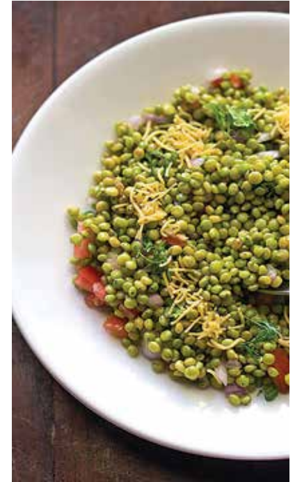
नागपूर अधिवेशनात हार्डा पार्टी झालीच पाहिजे...

शरद पवार (पुलोद शासन), बॅ. अ. र. अंतुले, त्यानंतर बॅ. बाबासाहेब भोसले,