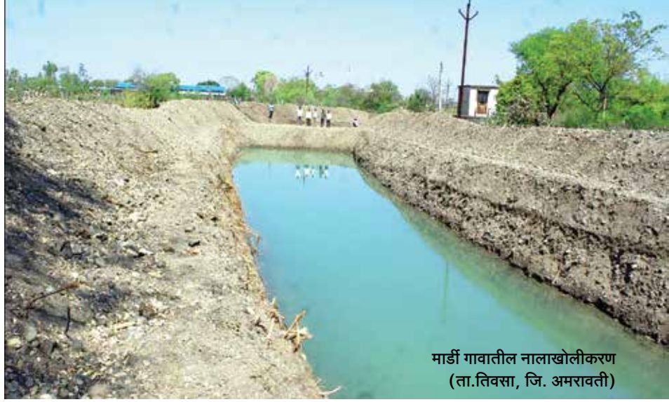
मार्डी गावातील नालाखोलीकरण (ता.तिवसा, जि. अमरावती)

तंत्रज्ञान, कृषीची निकड, भूजल सर्व्हेक्षण यंत्रणेचे मापदंड, पाणी पुरवठ्याची यंत्रणा, वन विभागाची उपचाराची कामे, सामाजिक वनीकरणाचे सहकार्य या सर्वसमावेशक उपाययोजनांमधून; एकात्मिक पद्धतीने अवर्षण स्थितीवर मात करण्यासाठी प्रयत्न केले जात आहेत. यातून प्राधान्याने पिण्यासाठी आणि शेतीसाठी पाणी उपलब्ध करून दिले गेले. अमरावती विभागात गुणवत्तापूर्ण आणि पारदर्शी पद्धतीने या शिवार योजनेतर्गत एकात्मिक पद्धतीने कामे करण्यावर भर दिला जात आहे. २०१५-१६ या वर्षात पाच जिल्ह्यातील एक हजार ३९६ तर २०१६-१७ मध्ये ९९७ गावांमध्ये हे अभियान राबवण्यात येत आहे. या दोन वर्षांतील ७१ हजार ८५८ कामांची फलनिष्पत्ती ही निर्माण झालेल्या दोन लाख ४३ हजार ५७० टीसीएम पाणीसाठा क्षमतेवरून दिसून येते आणि यासाठी प्रती टीसीएम खर्च केवळ ४६ हजार ५४९ रुपये