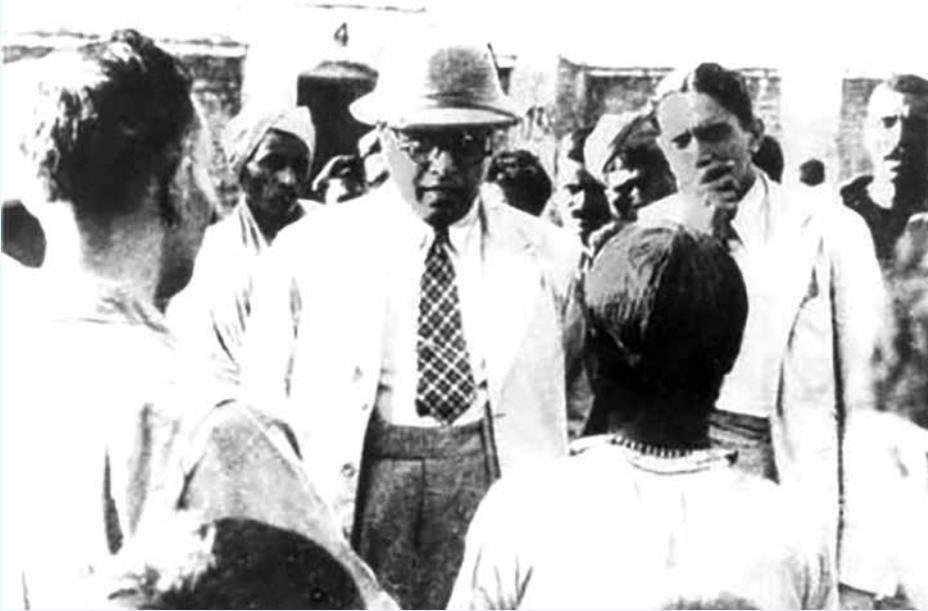
व्हाईसरॉय काऊन्सिलमध्ये कामगार मंत्री म्हणून समाविष्ट असलेले डॉ. बाबासाहेब आंबेडकर जनतेशी संवाद साधताना.

सिद्धार्थ महाविद्यालय अगोदर मरीन लार्न्स वरील सुंदराबाई हॉल शेजारी असलेल्या मोकळ्या जागेतील बॅरक्समध्ये भरत असे. हे बॅरक्स दुसऱ्या महायुद्धाच्या कालखंडात तात्पुरत्या स्वरूपात बांधले असल्यामुळे, तेथे नियमित राहणे शक्य नव्हते. यावेळेस फोर्ट इलाख्यात फ्लोरा फाऊंटनच्या जवळ जपानी बँकेच्या मालकीच्या दोन इमारती रिकाम्या होत्या. या इमारती महाविद्यालयासाठी सुयोग्य आहेत असे लक्षात येताच बाबासाहेबांनी दिल्ली मुक्कामी हालचाली सुरू केल्या. परंतु यश मात्र येईना. तेव्हा बाबासाहेबांनी लेडी माऊंटबॅटनला भेटून सविस्तर कथन केले. तिचे पत्र घेऊन भारताचे पंतप्रधान पंडित जवाहरलाल नेहरू यांची भेट घेतली. पंडितजींचे शिक्षणावर अतिशय प्रेम होते. शिक्षणासारख्या पवित्र कार्यासाठी या दोन्ही इमारतींचा वापर होणार आहे हे पाहून पंडित जवाहरलाल नेहरूंनी या दोन्ही इमारती पीपल्स एज्युकेशन सोसायटीला देण्याचे