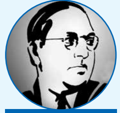
महापरिनिर्वाण दिन विशेष

आंबेडकरांनी धर्मातराची घोषणा केली. त्यांच्या काही आततायी अनुयायांनी मुस्लीमधर्म स्वीकारला आणि भारतीय हिंदूच्या राजकारणात प्रचंड खळबळ निर्माण झाली. खरे म्हणजे त्याआधी काही महिने बाबासाहेब वेरुळला आले होते. दौलताबादचा किल्ला पाहण्यासाठी ते गेले. किल्ल्याबाहेरच्या हौदावर त्यांच्या काही कार्यकर्त्यांनी हातपाय धुतले, पाणी पिले. एवढ्या कारणासाठी 'आमचा हौद बाटवला' असे म्हणत अतिरेकी मुस्लीम अंगावर धावून गेले. असे हे बाबासाहेब धर्मातराची घोषणा करतात तेव्हा त्यांच्या मनात मुस्लीम धर्म होता असा तर्क करणेसुद्धा केवळ मूर्खपणाच आहे. पण ह्या दोन घटना आणि १९३८ नंतर हैदराबादमधील आंदोलनाने धारण केलेले उग्ररूप, ह्या पार्श्वभूमीवर जणू काही