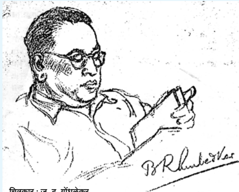
चित्रकार : ज. द. गोंधळेकर

मुंबईबाहेर सभा, परिषदेसाठी बाबासाहेब असताना अनेक लोक त्यांच्याबरोबर असायचे. सर्वांची व्यवस्था लावणे स्थानिक मंडळींना अवघड जायचे. अशा वेळी बाबासाहेब परिस्थितीप्रमाणे वेळ मारून नेत. एकदा सातारा जिल्ह्यात पेटला परिषद होती. दुपारी स्थानिक मंडळींनी व्यवस्था केल्याप्रमाणे व्यवस्थित जेवणे झाली होती. संध्याकाळी जेवण करण्यास त्रास नको म्हणून त्या मंडळींना बाबांनी सांगून टाकले की सायंकाळी आपल्याला जेवण नको. मांडे, शेंगदाणे व गूळ असला म्हणजे काम भागेल. अशा प्रवासात काही वेळा त्यांना बेडिंगची जरूर लागत नसे. साध्या घोंगडीवर आपली पथारी ते टाकून देत.