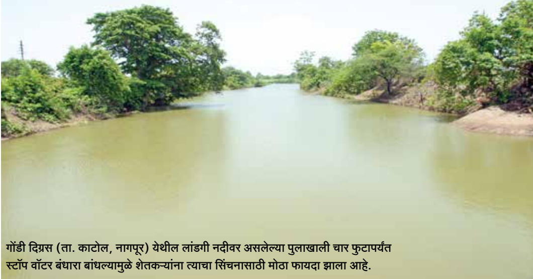
गोंडी दिग्रस (ता. काटोल, नागपूर) येथील लांडगी नदीवर असलेल्या पुलाखाली चार फुटापर्यंत स्टॉप वॉटर बंधारा बांधल्यामुळे शेतकऱ्यांना त्याचा सिंचनासाठी मोठा फायदा झाला आहे.

कामे सुरू करण्यात आली. ही सर्व कामे पूर्ण झाली असून यातून १ लाख ७८ हजार ८०० टीसीएम पाणीसाठा क्षमता निर्माण झाली आहे. त्यामुळे ८३ हजार ७२४ हे. क्षेत्र हंगामी सिंचनाखाली आले आहे. निवड झालेली सर्व १०७७ गावे जल परिपूर्ण (water neutral) झाली आहे. या योजनेतर्गत २०१६-१७ मध्ये नागपूर विभागातील सहा जिल्ह्यांमध्ये एकूण ९१५ गावांची निवड करण्यात आली होती. त्यापैकी ६५९ गावे जल परिपूर्ण (water neutral) झालेली आहेत. निवड करण्यात आलेल्या गावांमध्ये एकूण २०