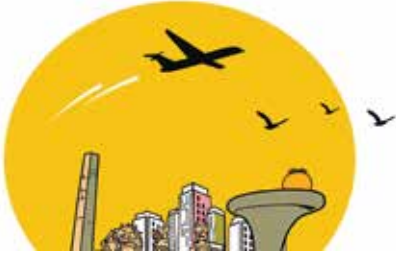
'इंडियाज् हार्ट, नागपूर स्मार्ट' १९

'इंडियाज् हार्ट, नागपूर स्मार्ट' असे ब्रीद घेऊन महाराष्ट्राच्या उपराजधानीची अर्थात नागपूर शहराची वाटचाल 'स्मार्ट सिटी'च्या दिशेने सुरू झाली आहे. त्यामुळे केवळ राज्याचे नव्हे तर देशाचे लक्ष भविष्यातील 'स्मार्ट सिटी' म्हणून नागपूरकडे लागले आहे.