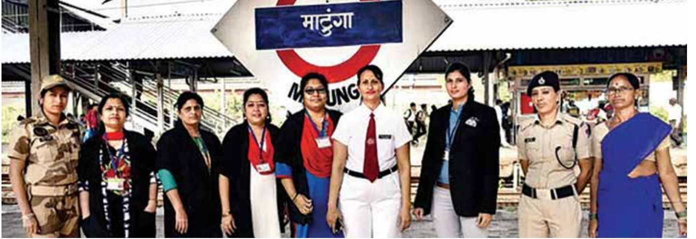
माटुंगा रेल्वे स्थानक चालवणारी महिला शक्ती.