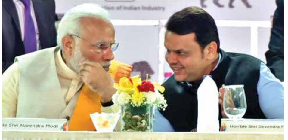
मॅनेटिक महाराष्ट्र परिषदेत प्रधानमंत्री नरेंद्र मोदी आणि मुख्यमंत्री देवेंद्र फडणवीस

नवे कायदे जनतेच्या कल्याणासाठी केले आहेत. आर्थिक सुधारणा करण्याच्या दृष्टीने सरकारने अनेक बदल अर्थसंकल्पात करून सर्वसामान्य व्यक्ती नजरेसमोर ठेऊन; विश्वास साधण्याचे ध्येय निश्चित केले आहे. नव्या आर्थिक धोरणांचा लाभ दलित, मागासवर्गातील जनता आणि शेतकऱ्यांना होईल. सर्वाना घरे, शुद्ध पाणी, मुबलक वीज, चांगले रस्ते, चांगल्या आरोग्याच्या सुविधा हे ध्येय गाठायचे आहे. आयुष्यमान भारत या योजनेत १० कोटी कुटुंबांना आरोग्य विमा देण्याचे उद्दिष्ट आहे. ग्रामीण भागात वेलनेस सेंटर स्थापनाचा निर्धार आहे. शैक्षणिक क्षेत्रातील सुधारणांसाठी १ लाख कोटींची योजना आहे. मुद्रा योजनेतून लाखो रुपयांचे कर्ज दिले आहे. म्हणूनच 'मेक इन इंडिया' हे धोरण शाश्वत विकासाच्या दृष्टीने महत्त्वपूर्ण आहे, असे या परिषदेत प्रधानमंत्री श्री. मोदी यांनी सांगितले.