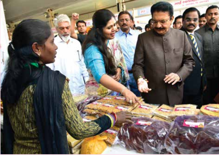
महालक्ष्मी सरस २०१८ प्रदर्शनीमध्ये एका बचतगटातील वस्तूची पाहणी करताना राज्यपाल सी. विद्यासागर राव, महिला व बालविकास मंत्री पंकजा मुंडे, राज्यमंत्री दादाजी भुसे.

कोणत्याही परिस्थितीला धैर्याने सामोरे जाण्याची तसेच अडचणीच्या काळात स्वतःबरोबर संपूर्ण कुटुंबाला सावरण्याची महिलांच्यातली आंतरिक शक्ती समाजाला नेहमीच बळ देत आली आहे. सरस महालक्ष्मी प्रदर्शनाच्या निमित्ताने हे मला जवळून बघायला मिळाले. मागच्या वर्षी दुष्काळग्रस्त भागातील बचतगटांच्या महिला आपली उत्पादने घेऊन मुंबईत सरस प्रदर्शनात सहभागी झाल्या होत्या. या प्रदर्शनात आपल्या उत्पादनांची विक्री करून, या महिलांनी चांगला व्यवसाय केला व दुष्काळात सापडलेल्या आपल्या कुटुंबाला फार मोठा आर्थिक आधार दिला. सरस महालक्ष्मी प्रदर्शनात कॅशलेस व्यवहाराची सुविधा उपलब्ध करून देण्यात आली होती. गावाकडून आलेल्या महिला मोठ्या आत्मविश्वासाने स्वाइप मशीन, पीओएस मशीन, डेबीट कार्ड, क्रेडीट कार्ड, मोबाईल बँकींग, ई-वॉलेट, पेटिएम यांचा वापर करून व्यवहार करीत होत्या. महिलांमधील आत्मविश्वास व आर्थिक स्वावलंबन वाढीला लागले आहे, हेच या प्रदर्शनाचे मोठे यश आहे असे मला वाटते.