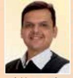
श्री. देवेंद्र फडणवीस मा. मुख्यमंत्री

श्री. संभाजी दिलीपराव पाटील निलंगेकर मा. मंत्री, कामगार