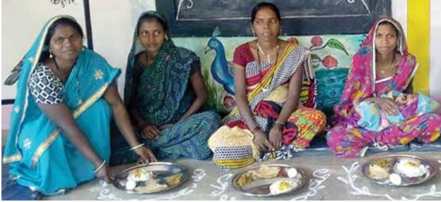
अमृत आहार योजनेतर्गत सकस आहार घेताना आदिवासी महिला.

राज्य नेहमीच युवा मुले, पौगंडावस्थेतील मुले व स्त्रियांना पोषक आहार देण्याच्या बाबतीत आघाडीवर राहिले आहे. त्याचबरोबर आरोग्य व पोषण मिशनची स्थापना करणारे राज्य देशात पहिले आहे. २००५ मध्ये या मिशनची सुरुवात करण्यात आली.