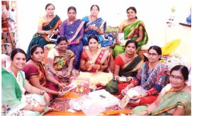
सुटाळा खुर्द येथील महिला बचतगटाचे रेशामचे दागिने.