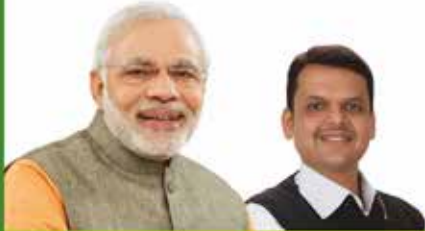
श्री. नरेंद्र मोदी भा. प्रधानमंत्री