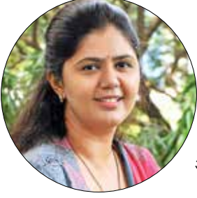
मंत्री, महिला व बालविकास, ग्रामविकास

राजमाता जिजाऊ, सावित्रीबाई फुले, अहिल्याबाई होळकर या श्रेष्ठ महिलांच्या जन्मभूमीत आपलाही जन्म झाला याचा मला नेहमीच अभिमान आणि आनंद वाटत असतो. महिलांमध्ये अंगभूत शक्ती, सर्जनशीलता आणि असामान्य कर्तृत्व गाजवण्याची क्षमता अपार आहे. महिलांना कोणत्याही क्षेत्रात कर्तृत्व गाजवण्याची संधी मिळाली