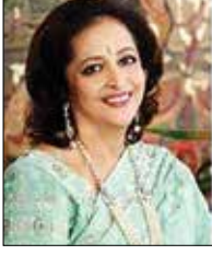
डॉ. स्वाती पिरामल