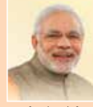
श्री. नरेंद्र मोदी मा. प्रधानमंत्री

महाराष्ट्र इमारत व इतर बांधकाम कामगार कल्याणकारी मंडळ