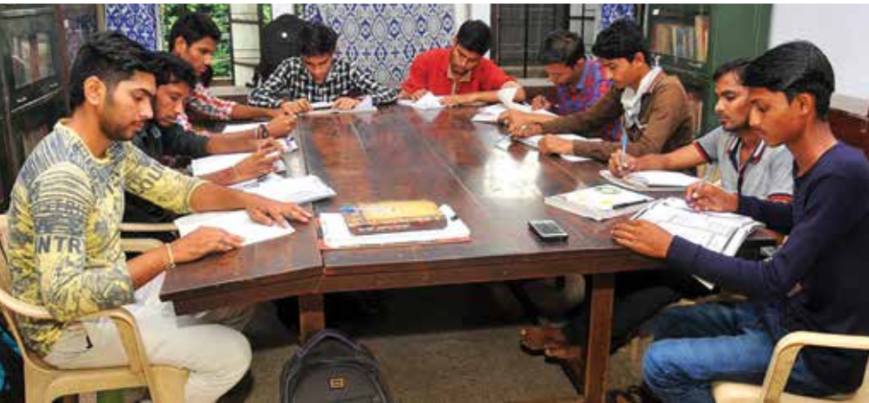
नागपूर-लोकराज्य क्लब अभ्यासिकेतील विद्यार्थी.