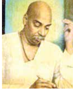
राष्ट्रसंत तुकडोजी महाराज