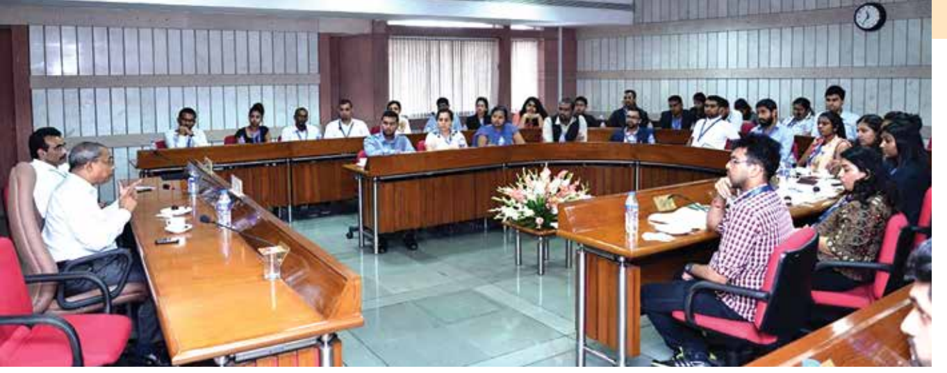
संसदीय अभ्यास आणि प्रशिक्षण संस्थेतील एका अभ्यासक्रमात सहभागी झालेले विद्यार्थी.

हा देश एकत्र राहूच शकत नाही, अशी भविष्यवाणी केली गेली. मात्र भारतीय संसदेने या भीतीला खोटे ठरवले आणि सार्वत्रिक विकासाची हमी देणारी लोकशाही ६५ वर्षांनंतर जगातील प्रगल्भ लोकशाही म्हणून पुढे आली.