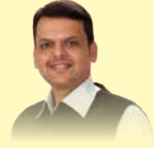
श्री. देवेन्द्र फडणवीस मा. मुख्यमंत्री