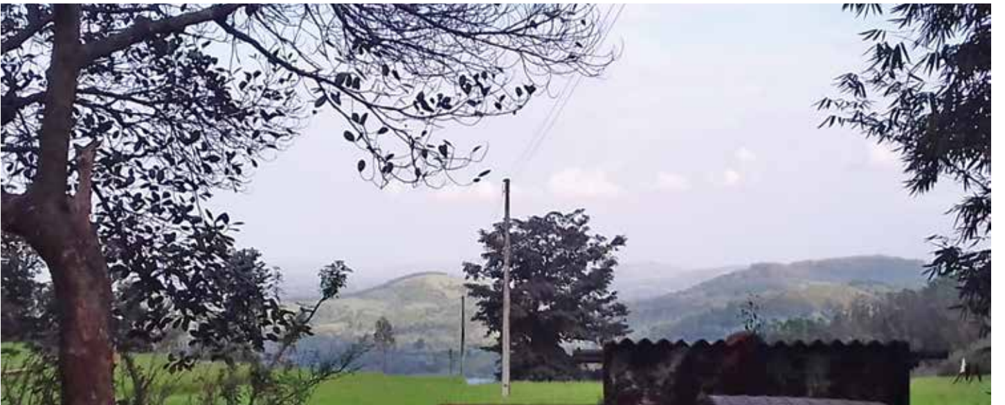
कोल्हापूर जिल्ह्यातील धनगरवाड्यांना प्रकाशमान करणारी विद्युत वाहिनी.

- एस. आर. माने, जिल्हा माहिती अधिकारी, कोल्हापूर.