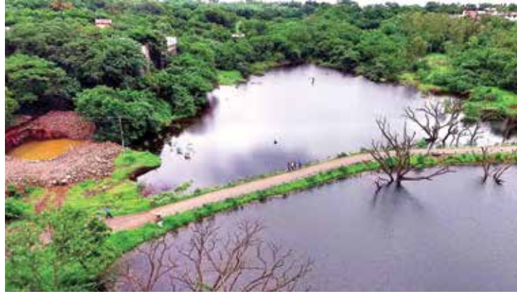
संगीतशास्त्र विभागाशेजारील भरलेला तलाव

सर्व प्रयत्नांतून विद्यापीठ सर्व खर्च वजा करून वर्षाला साठ ते सत्तर लाख रुपयांची बचत करत आहे. ते पैसे अन्य विकासात्मक कामासाठी वापरण्यास उपलब्ध होत आहेत. जलसाठ्यांबरोबर विद्यापीठातील जैवविविधताही चांगली वाढत आहे. परिसरात पक्ष्यांची संख्या वाढली आहे. मोर, साप, मुंगूस, ससा, खवल्या मांजर या विविध पक्ष्यांबरोबर कोल्हापूर दृशन दिले.