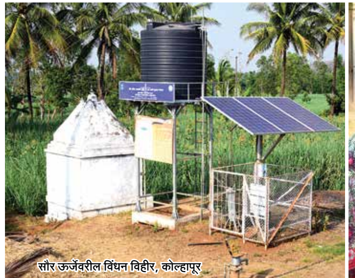
सौर ऊर्जेवरील विंधन विहीर, कोल्हापूर

बीड - तळेकर वस्ती ही तशी जेमतेम १५ घरांचीच वस्ती. नळपाणी पुरवठा योजनेत समावेश नसल्याने ती पाण्यापासून वंचित होती. ऐन उन्हाळ्यात या वस्तीतील विंधन विहिरीचा हातपंपाद्वारे पाणी उपसा बंद व्हायचा, मग दीड किलोमीटरवर असलेल्या भोगावती नदीतून पाणी आणताना तळेकर कुटुंबातील महिलांची दमछाक व्हायची. महिला वर्गाचा सारा वेळ पाणी आणण्यात जायचा. त्यामुळे शेतीच्या कामावर परिणाम होऊन शेती उत्पन्न कमी व्हायचे.