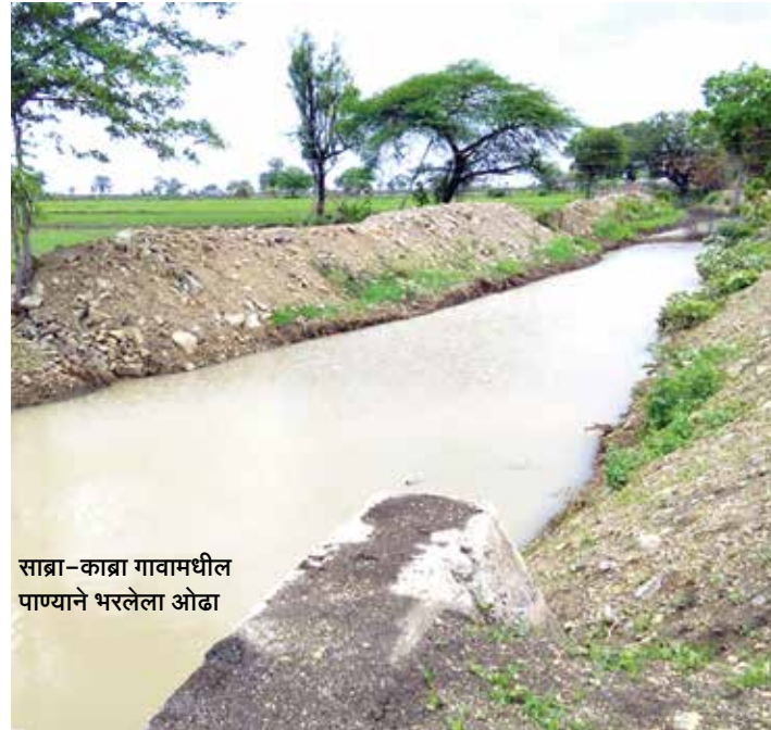
साब्रा-काब्रा गावामधील पाण्याने भरलेला ओढा

- एस. के बावस्कर, जिल्हा माहिती अधिकारी, बुलडाणा.