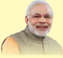
श्री. नरेंद्र मोदी मा. प्रधानमंत्री