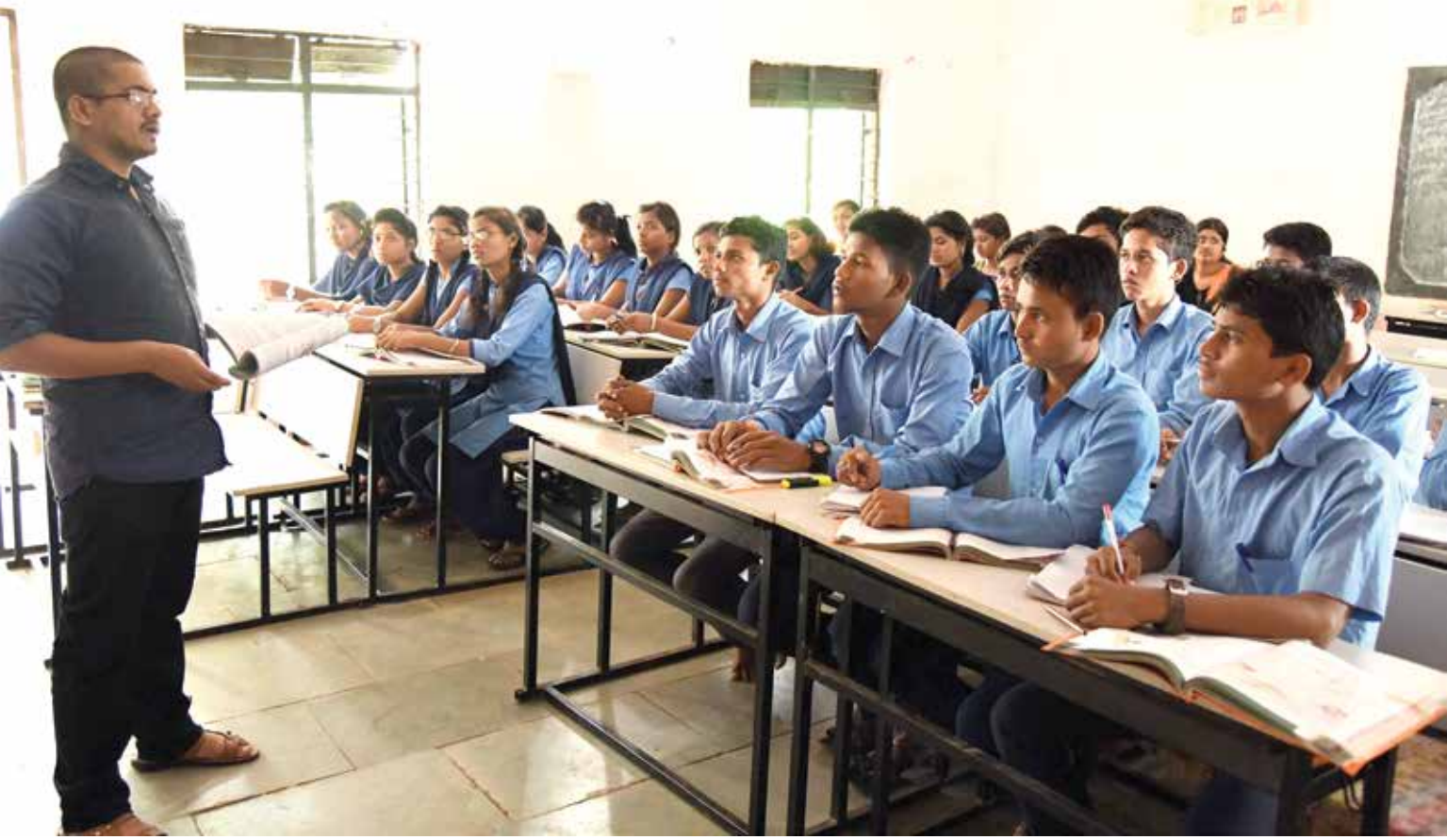
मेळघाटातील आदिवासी मुलांच्या वैद्यकीय प्रवेश परीक्षेची तयारी.