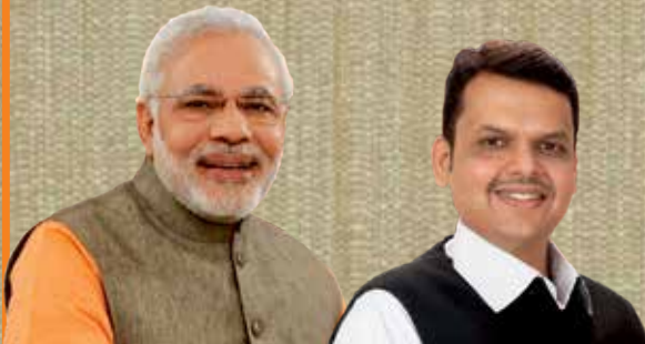
श्री. नरेंद्र मोदी मा. प्रधानमंत्री