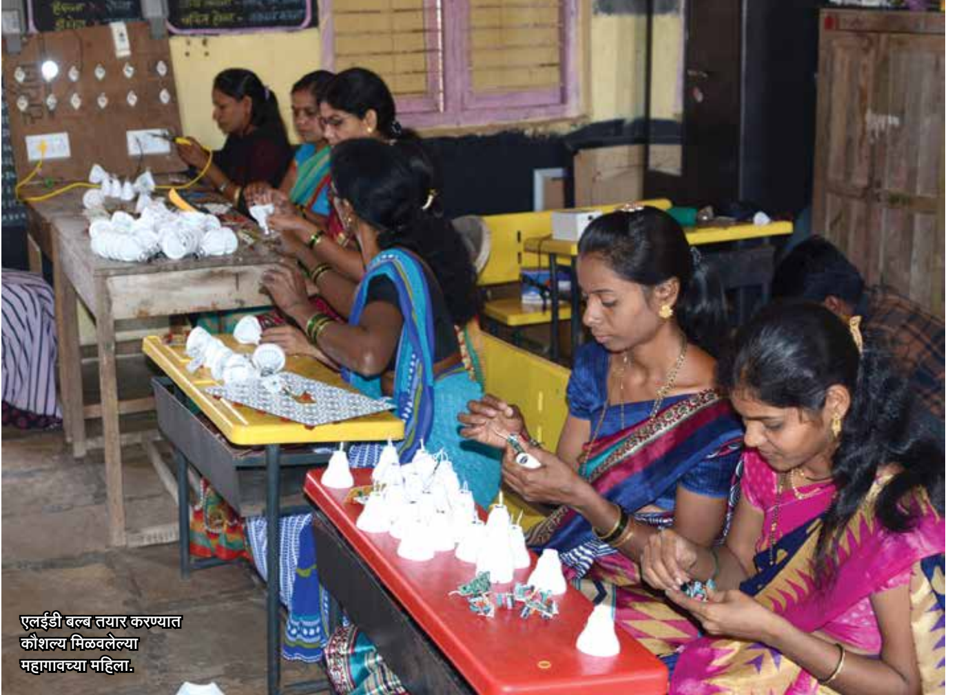
एलईडी बल्ब तयार करण्यात कौशल्य मिळवलेल्या महागावच्या महिला.