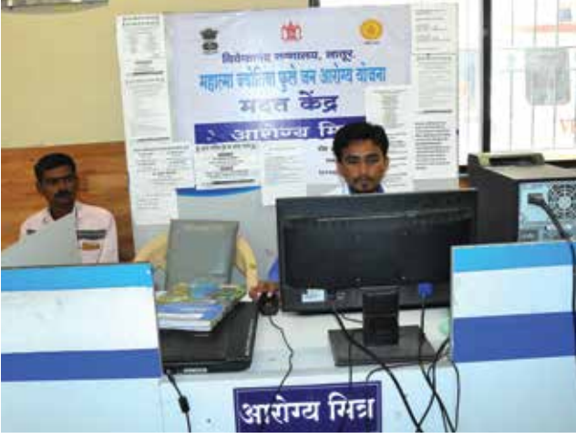
महात्मा फुले जन आरोग्य योजनेतर्गत तातडीने माहिती देणारे आरोग्य मित्र