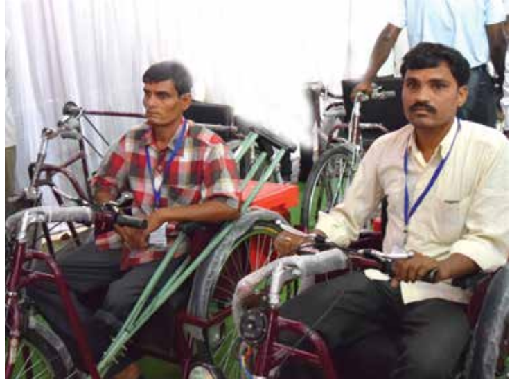
गोंदिया जिल्ह्यातील दिव्यांगांना सायकलीचे मोफत वाटप.

- सुनील सोनटके, जिल्हा माहिती अधिकारी, लातूर