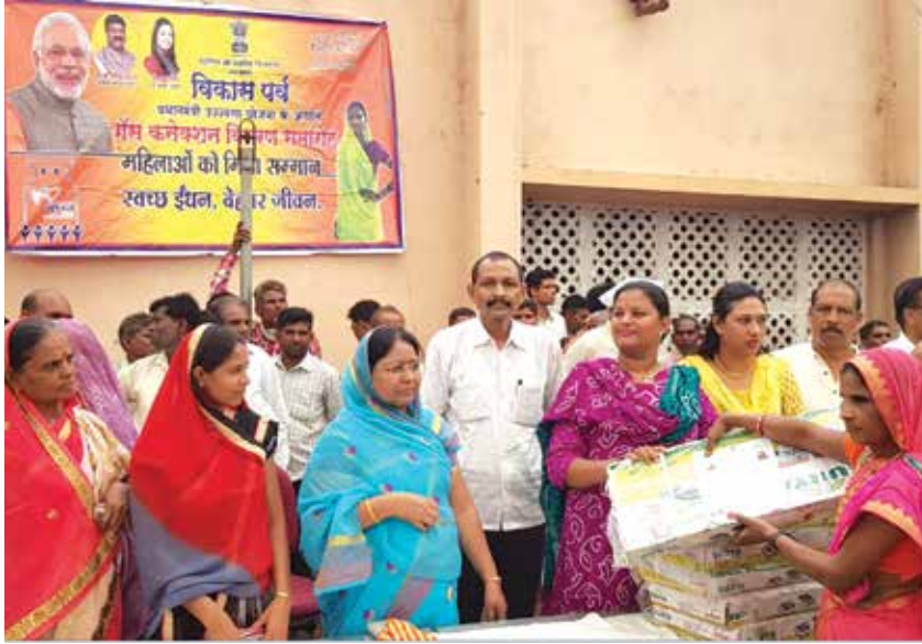
नंदुरबार येथे उज्ज्वला योजनेतर्गत लाभार्थ्यांना गॅस वाटप करताना खासदार हिना गावित.

या योजनेचा लाभ घेण्यासाठी लाभार्थ्याला एक अर्ज आपल्या जवळच्या एलपीजी वितरण केंद्रावर सादर करावयाचा आहे. एलपीजी केंद्रावर अर्ज निःशुल्क मिळतो. अथवा ऑनलाइन अर्ज भरता येतो. अर्ज सादर करताना अर्जदाराला आपले संपूर्ण नाव, पत्ता, आधार कार्ड नंबर, जन-धन बँक खात्याचे नंबर देणे बंधनकारक आहे. सोबतच पंचायत अधिकारी, नगरपालिका यांनी प्रमाणित केलेले बीपीएल प्रमाणपत्र, बीपीएल रेशन कार्ड, पासपोर्ट आकाराचा फोटो असणे आवश्यक आहे. योजनेतर्गत भरलेले अर्ज एसईसीसी २०११ या डाटासोबत जोडून तपासण्यात येतात. त्या आधारावर लाभार्थी या योजनेचा लाभ घेण्याकरिता पात्र किंवा अपात्र ठरवण्यात येतात. अर्जदाराचे वय १८ वर्षे पूर्ण असावे. दारिद्र्यरेषेखालील महिलांनी अर्ज करणे आवश्यक आहे. प्रधानमंत्री उज्ज्वला योजनेच्या पात्र लाभार्थ्यांना योजनेतर्गत गॅस कनेक्शन खरेदी करण्याकरिता १६०० रुपयांचे आर्थिक सहकार्य करण्यात येते.