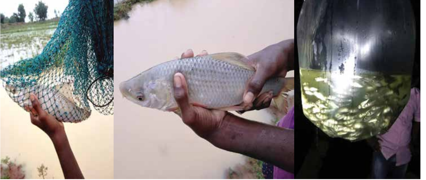
मत्स्यशेतीमुळे शेतकऱ्यांचे उत्पन्न दुप्पट होत आहे.