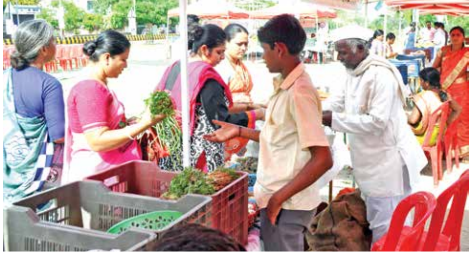
सोलापुरातील शेतकरी आठवडे बाजार.

सोलापुरात गेल्या वर्षीच्या जानेवारी महिन्यात पहिला शेतकरी आठवडे बाजार सुरु झाला. प्रादेशिक परिवहन कार्यालयाच्या परिसरात सुरु झालेल्या पहिल्या आठवडे बाजाराला मिळालेला प्रतिसाद पाहता, शहरात आणखी चार ठिकाणी आठवडे बाजार सुरु करण्यात आले. येत्या काही दिवसांत शहरांच्या