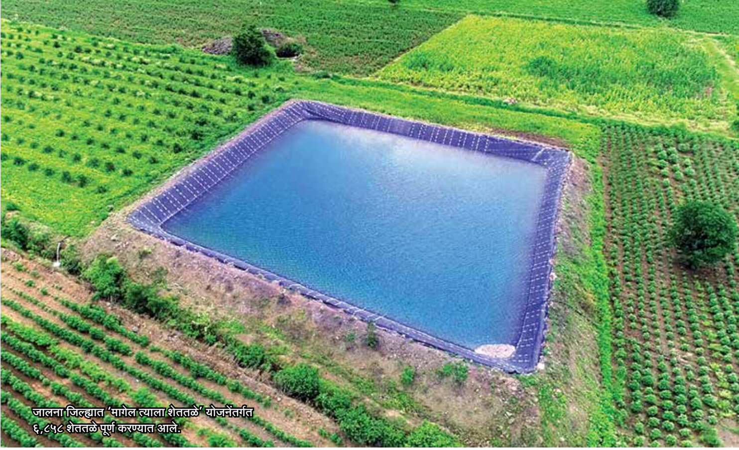
जालना जिल्ह्यात 'मागेल त्याला शेततळे' योजनेतर्गत ६,८५८ शेततळे पूर्ण करण्यात आले.

राज्यात गेल्या काही वर्षात पावसाचे प्रमाण कमी तसेच अनिश्चित झाले आहे. कोरडवाहू क्षेत्रातील पूर्णतः पावसावर अवलंबून असलेल्या पिकांवर तसेच त्याच्या उत्पादनावर विपरित परिणाम झाला आहे. या पार्श्वभूमीवर पावसात पडलेला खंड, पाण्याची टंचाई व पिकांचे नुकसान होऊ नये, यासाठी राज्य शासनाने मागेल त्याला शेततळे ही योजना सुरु केली. शेती उत्पादनामध्ये शाश्वतता आणण्यासाठी तसेच, दुष्काळावर मात करण्यासाठी शेततळे उपयुक्त ठरत आहे. यामुळे पर्जन्यावर आधारित कोरडवाहू शेतीसाठी पाणलोट व जलसंवर्धन माध्यमातून जलसिंचनाची उपलब्धता वाढवता येणे शक्य होईल. या माध्यमातून संरक्षित व शाश्वत सिंचनाची सुविधा मिळेल.