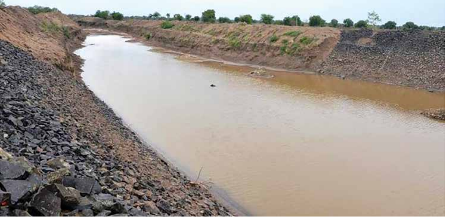
मृतप्राय झालेली कमळगंगा यंदाच्या पावसात दुथडी वाहू लागली.