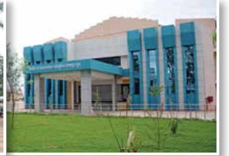
कर्मवीर मा.सां. कर्मवार सांस्कृतिक सभागृह, मूल

तीन वर्षात चंद्रपूर म्हणजे दारूबंदी झालेला जिल्हा, चंद्रपूर म्हणजे वाघांची संख्या वाढलेल्या नव्या स्वरूपातील ताडोबा अभयारण्याचा जिल्हा, नवे वैद्यकीय शासकीय महाविद्यालय सुरू झालेला जिल्हा, जपान-दुबईच्या तोडीची बांबू संशोधन व प्रशिक्षणाची इमारत उभारणारा जिल्हा, डेहराडून येथील वनप्रबोधिनीपेक्षा देखणी व आधुनिक सोयीनीयुक्त वनप्रबोधिनी साकारत असलेला जिल्हा, बेंगळुरुपेक्षा अधिक क्षमतेच्या वनस्पतींवर संशोधन करणारे बाॅटनिकल