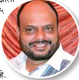
गुलाबराव पाटील सहकार राज्यमंत्री

जिल्ह्यातील ११ लाख ६५ हजार ८७८ सर्व्हे नंबरपैकी ११ लाख ३९ हजार ३३२ सर्व्हे नंबरचा ७/१२ ऑनलाइन करण्याचे काम जिल्ह्यात पूर्ण झाले आहे. यामुळे खातेदारांना आपल्या मालमत्तेचा ७/१२ ऑनलाइन मिळण्यास मदत होणार आहे.