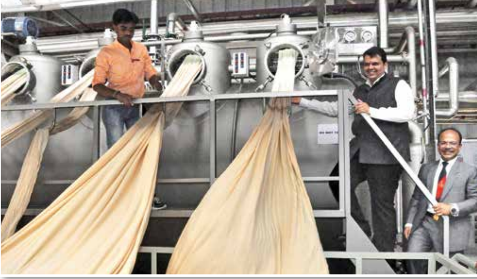
नांदगाव पेठ औद्योगिक वसाहतीमध्ये वस्त्रोद्योग उद्यानाच्या उद्घाटनानंतर वस्त्रोद्योग प्रकल्पाची पाहणी करताना मुख्यमंत्री देवेंद्र फडणवीस.

विपुल वनसंपदा, समृद्ध वन्यजीवनासाठी सुपरिचित असलेल्या अमरावती जिल्ह्यात विकास आणि पर्यावरणाचा समतोल साधत औद्योगिक व कृषी विकासासाठी शासनाने अनेक पावले उचलली आहेत. त्यामुळे सिंचन आणि आरोग्य सुविधांबरोबरच कृषी, आदिवासी विकास, पर्यटन, उद्योग, रोजगारनिर्मिती अशा विविध क्षेत्रात चांगले परिणाम दिसू लागले आहेत.