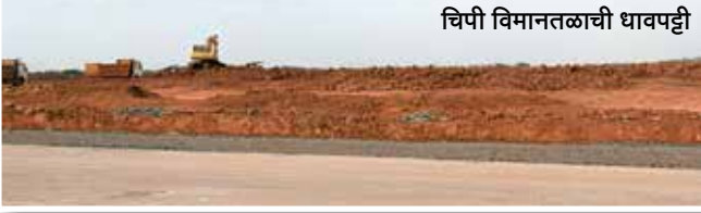
चिपी विमानतळाची धावपट्टी

सार्वजनिक-खासगी सहभाग या अंतर्गत चिपी येथे सिंधुदुर्ग विमानतळाचे काम सुरू आहे. या विमानतळ प्रकल्पासाठी २७६ हेक्टर जमिनीचे संपादन करण्यात आले. सिंधुदुर्ग विमानतळाचे प्रमुख वैशिष्ट्य म्हणजे या विमानतळावर विमानात इंधन भरण्याची सुविधा असणार आहे. आंतरराष्ट्रीय दर्जाच्या धर्तीवर याची धावपट्टी, रात्रीचे विमान उड्डाण व उतरण्याची सुविधा, अद्यायावत पॅसेंजर टर्मिनलची बिल्डींग, तसेच भविष्यातील लागणाऱ्या सर्व सुविधांचा विचार करून या विमानतळाच्या बांधकामाची विविध कामे युद्धपातळीवर सुरू आहेत.