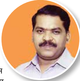
दिलीप कांबळे सामाजिक न्याय राज्यमंत्री

जिल्ह्याच्या विकासाची उड्डाणे वाढविण्याच्या दृष्टीने राज्य सरकारने जिल्ह्यातील पुरंदर तालुक्यात नव्याने छत्रपती संभाजीराजे आंतरराष्ट्रीय विमानतळाला मंजुरी दिली आहे. जमीन संपादनानंतर अवघ्या तीन वर्षात विमानतळाचे काम पूर्ण करण्यात येणार आहे. विमानतळासाठी २४०० हेक्टर क्षेत्राची आवश्यकता आहे. चार किलोमीटरपर्यंतच्या दोन मोठ्या धावपट्ट्या या ठिकाणी विकसित करण्यात येणार आहेत. या विमानतळात स्थानिक शेतकरीच भागीदार असणार आहेत. तसेच प्रकल्पबाधितांना चांगला परतावा मिळणार आहे. पश्चिम महाराष्ट्रासह लगतच्या मराठवाड्यातील काही जिल्ह्यांनाही या विमानतळाचा उपयोग होणार आहे.