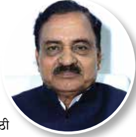
दिवाकर रावते परिवहन मंत्री

पहिल्या टप्प्यात दक्षिण मुंबईमधील प्रिन्सेस स्ट्रीट ते वरळीदरम्यान ९.९८ कि.मी. लांबीचा मार्ग उभारण्यात येणार आहे. पहिल्या टप्प्यात समुद्रामध्ये ८९ हेक्टर क्षेत्रात भरणी करण्यात येणार आहे. या टप्प्यासाठी ५३०३ कोटी रुपये खर्च येणार आहे. या मार्गामुळे प्रवासाची वेळ ७० टक्क्यांनी कमी होईल आणि ३४ टक्के इंधनाची बचत होईल, असा अंदाज वर्तवण्यात येत आहे.