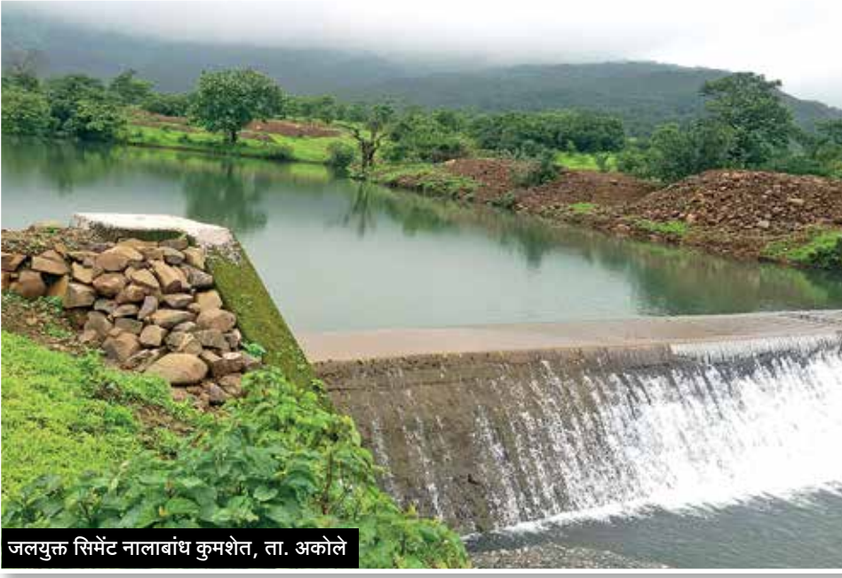
जलयुक्त सिमेंट नालाबांध कुमशेत, ता. अकोले

जलयुक्त शिवार अभियानाला अहमदनगर जिल्ह्यात लोकचळवळीचे स्वरूप आले आहे. जलयुक्त शिवार अभियानाच्या कामातून टंचाईग्रस्त गावांची जलस्वयंपूर्ण गावाकडे वाटचाल सुरू आहे. गावातील पीकपद्धती बदलली असून १ लाख ९२ हजार हेक्टर क्षेत्र सिंचनाखाली आले आहे. गावशिवारात झालेल्या कामांमुळे ९६ हजार टीसीएम एवढा पाणीसाठा निर्माण झाला आहे.