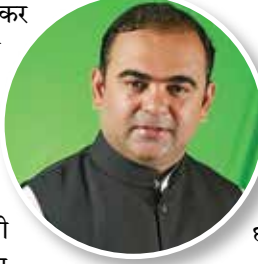
जयकुमार रावल पर्यटन, रोहयो मंत्री

प्रधानमंत्री कृषी सिंचन योजनेतर्गत जिल्ह्यात गेल्या आर्थिक वर्षात ३ हजार २२१ शेतकऱ्यांच्या ४ हजार ४७४ हेक्टर क्षेत्राला लाभ देण्यात आला. त्यांच्या चालू वित्तीय वर्षासाठी जिल्ह्यात १० हजार १२७ शेतकऱ्यांच्या ८ हजार ५७८ हेक्टर क्षेत्रासाठी सिंचन प्रकल्प प्रस्तावित आहे. जिल्ह्यात मागेल त्याला शेततळे योजनेत आतापर्यंत ६२ शेततळ्यांचे काम पूर्ण झाले आहे. त्यावर २८ लाख ९७ हजारांचा निधी खर्च झाला आहे.