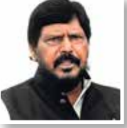
रामदास आठवले केंद्रीय सामाजिक न्याय राज्यमंत्री

केंद्र सरकारला २६ मे २०१७ ला ३ वर्षे पूर्ण झाली आहेत. या कार्यकाळामध्ये देशाला सामाजिक न्यायाच्या दिशेने घेऊन जाण्यामध्ये सामाजिक न्याय व अधिकारिता मंत्रालयाचे विशेष योगदान आहे. या विभागाचे राज्यमंत्री म्हणून सामाजिक न्यायाची जाण असणाऱ्या आणि भारतरत्न डॉ. बाबासाहेब आंबेडकरांच्या समतावादी विचारांचा प्रचार व प्रसार करणारे रामदास आठवले यांनी ५ जुलै २०१७ रोजी मंत्रिपदाचे १ वर्ष पूर्ण केले. सामाजिक न्याय विभागाला लोकाभिमुख करण्यासाठी ते सातत्याने प्रयत्न करत आहेत.