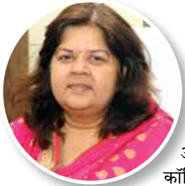
विद्या ठाकूर महिला व बालविकास राज्यमंत्री

येथील इंदू मिलची जागा केंद्र सरकारने राज्य सरकारकडे हस्तांतरीत केली आहे. त्यामुळे डॉ. बाबासाहेब आंबेडकर यांच्या साडेतीनशे फूट उंचीच्या स्मारक उभारणीसाठीचा मार्ग मोकळा झाला आहे. या स्मारकाचे भूमिपूजन प्रधानमंत्री नरेंद्र मोदी यांच्या हस्ते करण्यात आले आहे.