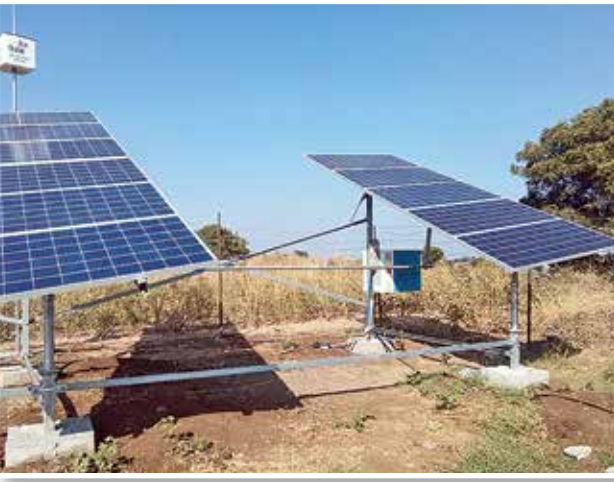
अटल सौर कृषी पंप योजनेतर्गत बसवण्यात आलेला सौर कृषी पंप.