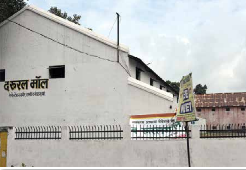
वर्धा येथे शेतकऱ्यांसाठी उभारण्यात आलेला रुरल मॉल