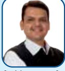
श्री. देवेन्द्र फडणवीस मा. मुख्यमंत्री