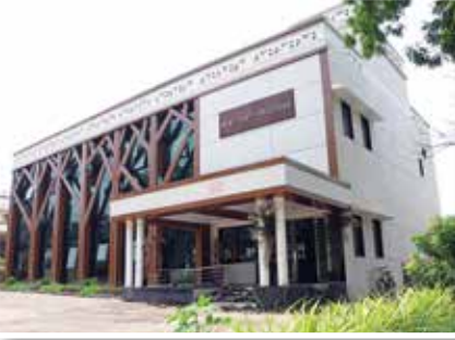
बाबा आमटे अभ्यासिका, चंद्रपूर