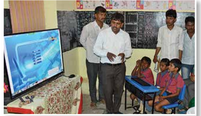
डिजिटल शाळा, मजले चिंचोली, जि. अहमदनगर

जिल्ह्यात डिजिटल अंगणवाणी केंद्रामध्ये टी.व्ही. सिडी प्लेअर, मॅट, बोलक्या भिंतीची सजावट करण्यात आली असून त्यासाठी लोकसहभागातून ८८ लाख रुपये खर्च करण्यात आला आहे. या माध्यमातून २ हजार १४२ अंगणवाड्या डिजिटल करण्यात आल्या आहेत. यासोबत वजन सनियंत्रण, बेटी बचाव बेटी पढाओ उपक्रम, डॉ. ए.पी.जे. अब्दुल कलाम अमृत आहार योजना, कराटे प्रशिक्षण, जलशुद्धीकरण यंत्रांचा पुरवठा अशा विविध योजना महिला व बालकल्याण विभागाच्या माध्यमातून राबवण्यात आल्या आहेत. ग्रामबालविकास केंद्राच्या माध्यमातूनही कामे सुरू आहेत.