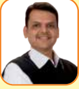
श्री. देवेंद्र फडणवीस मा. मुख्यमंत्री