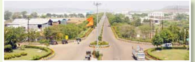
एमआयडीसी रस्ते, शेंद्रा

जगात औरंगाबादचे नाव अजिंठा, वेरूळ लेण्यांमुळे प्रसिद्ध आहे. पूर्वीपासूनच जिल्ह्याला वेगळी ओळख निर्माण झाली आहे. गेल्या तीन वर्षात जिल्ह्याची सर्वच क्षेत्रात प्रगतीकडे झपाट्याने वाटचाल सुरू आहे.