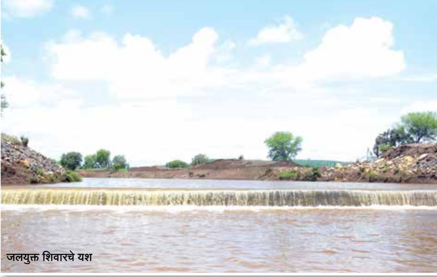
जलयुक्त शिवारचे यश