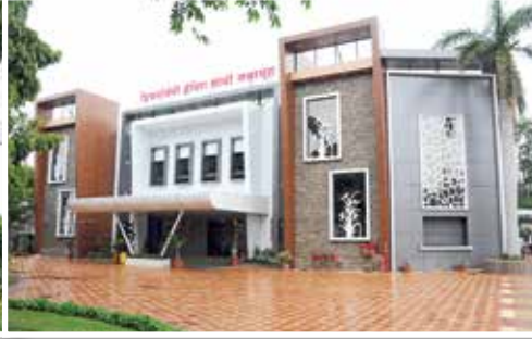
प्रियदर्शनी इंदिरा गांधी सभागृह, चंद्रपूर