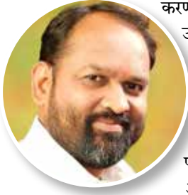
महादेव जानकर पदुम मंत्री

करण्यात आली. यंदा ७ लाख ६३ हजार एवढे उद्दिष्ट असताना ८ लाखांच्या वर वृक्षलागवड करण्यात आली.