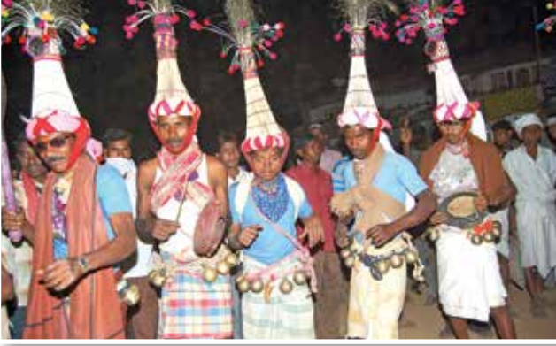
अकलकुवा तालुक्यातील काठी येथील रजवाडी होलिकोत्सव

नंदुरबार जिल्ह्यात सारंगखेडा विस्तीर्ण अशा सातपुड्याच्या रांगा आहेत. या रांगांमध्ये महाबळेश्वरनंतर राज्यातील दुसऱ्या क्रमांकाचे थंड हवेचे ठिकाण तोरणमाळ आहे. सारंगखेडा व अस्तंबा यात्रा भरते. जिल्ह्यातून तापी आणि नर्मदा नदी वाहते. तापीवरील प्रकाशे व सारंगखेडा बॅरजमध्ये बारमाही पाणी उपलब्ध आहे. तेथे बोटिंग सुरू करता येईल का याची चाचपणी केली जात आहे. याशिवाय उनपदेव गरम पाण्याचे झरे येथे आहेत. प्रकाशासारखे तीर्थक्षेत्र या जिल्ह्यात आहे. या पर्यटन व तीर्थस्थळांच्या विकासासाठी गेल्या वर्षी १ कोटी ५५ लाखांचा निधी उपलब्ध करून देण्यात आला. सारंगखेडा येथे आंतरराष्ट्रीयस्तरावरील अश्व संग्रहालयास चालना देण्यात आली आहे. सारंगखेडा यात्रेचे राष्ट्रीय, आंतरराष्ट्रीय स्तरावर विविध माध्यमातून ब्रँडिंग करण्यात येत आहे. काळमदेव, प्रकाशा,