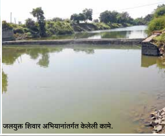
जलयुक्त शिवार अभियानांतर्गत केलेली कामे.