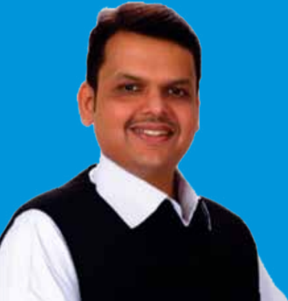
श्री. देवेंद्र फडणवीस मा. मुख्यमंत्री

अधिक माहितीकरिता- https://mhada.maharashtra.gov.in