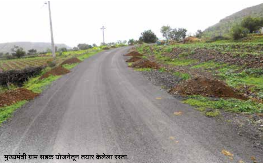
मुख्यमंत्री ग्राम सडक योजनेतून तयार केलेला रस्ता.