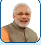
श्री. नरेंद्र मोदी मा. प्रधानमंत्री