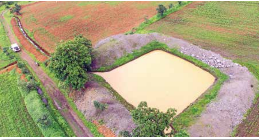
शेततळे, आमखेडा, जि. वाशिम

दशलक्ष घनमीटर (द.ल.घ.मी.) पाणीसाठा निर्माण होऊन १३ हजार ३२० हेक्टर क्षेत्राला सिंचनाची सुविधा उपलब्ध झाली आहे.