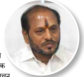
रामदास कदम पर्यावरण मंत्री

रत्नागिरी जिल्ह्यातील हवामान, फळझाडे, भाजीपाला आणि मसाला पिकांच्या उत्पादनास अत्यंत अनुकूल आहे. या पिकांचे क्षेत्र, उत्पादन आणि उत्पादकता वाढवण्याच्या दृष्टीने केंद्र व राज्य शासनपुरस्कृत वेगवेगळ्या योजना राबवण्यात येतात. जिल्ह्यात फलोत्पादनाखालील एकूण क्षेत्र १,६४,४६८ हेक्टर आहे. त्यापैकी आंबा फळपिकाखाली ६५,५६१ हेक्टर काजू ९२, ४५५ हेक्टर, नारळ ५,१९९ हेक्टर चिकू १,१२९ हेक्टर व इतर फळपिकाखालील १,१२६ हेक्टर क्षेत्र आहे.