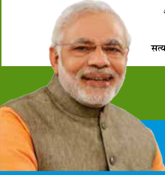
श्री. नरेंद्र मोदी, मा.प्रधानमंत्री