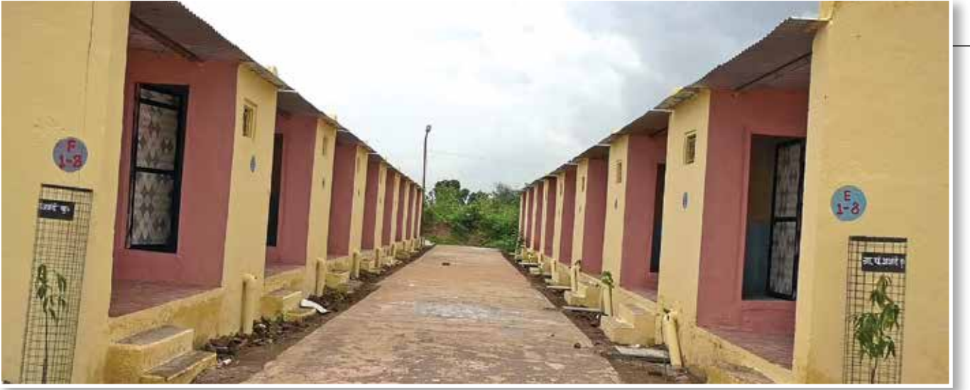
अजंदे बुद्रुक, ता. शिरपूर, जि. धुळे येथे बांधण्यात आलेली घरकुले