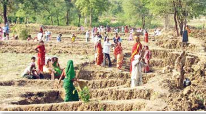
रोजगार हमी योजनेतर्गत काम करताना मजूर.