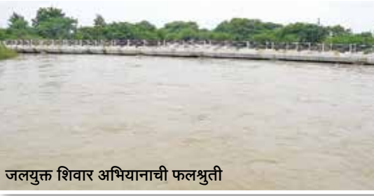
जलयुक्त शिवार अभियानाची फलश्रुती