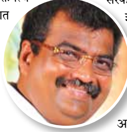
रविंद्र चव्हाण वैद्यकीय शिक्षण, माहिती व तंत्रज्ञान राज्यमंत्री

श्रमाची कामे करतांना दिसतो. विशेषतः बांधकाम कंत्राटदार, मोबाइल कंपन्यांकडील श्रमिक कामे, जलवाहिन्या किंवा रस्त्याच्या कामांसाठी खडे खोदणे अशा कामांवर हे युवक जातात. या भागात पावसाळ्यातील भातशेतीचा अपवाद वगळता उर्वरित हंगामात इतर कुठलीही शेतीची कामे नसतात, अशा वेळी हा मोठ्या प्रमाणावर असलेला युवक वर्ग आणि त्यांची शक्ती निरुद्देश कामासाठी व्यर्थ ठरते आणि अकार्यक्षम कामासाठी वापरली गेल्याने जिल्ह्याच्या उत्पादनात काही भर पाडत नाही हे लक्षात घेऊन या ठाणे कुशल या नावाखाली अभिनव अशा कौशल्य विकास केंद्राची निर्मिती करण्याचे ठरले. जिल्हा प्रशासनाने पुढाकार घेऊन सुरू केलेले हे एकमेव केंद्र आहे. या केंद्रात विविध बाबतीत कौशल्य विकासाचे प्रशिक्षण देताना विद्यार्थ्यांच्या व्यक्तिमत्व विकासाच्या दृष्टीने सॉफ्ट स्किल्समध्येही त्यांना पारंगत करण्यात येत आहे. राष्ट्रीय कौशल्य विकास कार्यक्रमांतर्गत जिल्ह्यातील प्रकल्पग्रस्त, आदिवासी व बेरोजगार युवकांना रोजगाराभिमुख कौशल्य विकास प्रशिक्षण देणे व रोजगार/स्वयंरोजगारक्षम बनवणे यासाठी प्रमोद महाजन कौशल्य विकास केंद्राची स्थापना करण्यात आली आहे.