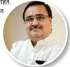
प्रकाश महेंता गृहनिर्माण मंत्री