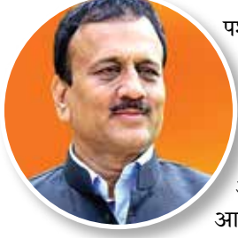
गिरीश महाजन जलसंपदा मंत्री

पशू वैद्यकीय महाविद्यालय, चाळीसगाव येथे डेअरी डेव्हलपमेंट महाविद्यालय कार्यान्वित होणार आहे.