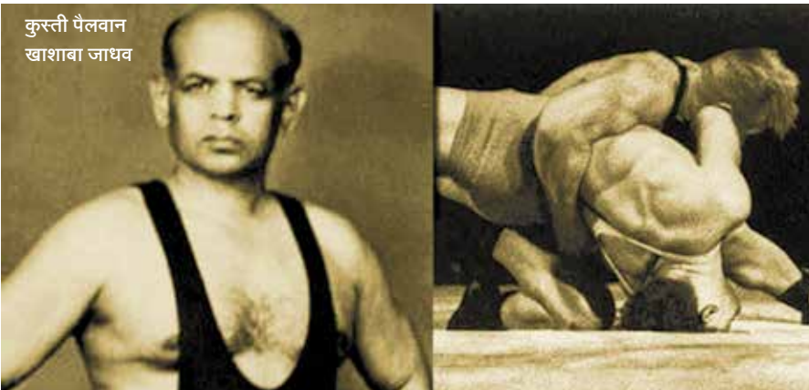
कुस्ती पैलवान खाशाबा जाधव

स्वतंत्र भारताला ऑलिम्पिकमध्ये पहिले वैयक्तिक पदक कुस्तीतील पैलवान खाशाबा जाधव यांनी मिळवून दिले. १९५२ च्या हेलसिंकी ऑलिम्पिकमध्ये त्यांनी बॅटमवेट प्रकारात कांस्य जिंकले होते. त्यांच्या विजयानंतर कराडपासून त्यांचे गाव गोळेश्वरपर्यंत काढण्यात आलेली १५१ बैलगाड्यांची मिरवणूक अनेक पैलवानांना प्रेरित करणारी ठरली. त्यांच्यानंतर देशाला ऑलिम्पिकमध्ये वैयक्तिक पदक मिळायला ४४ वर्षे लागली. प्रतिकूल परिस्थितीत त्यांनी साकारलेले यश देशाच्या क्रीडा क्षेत्रातील एक सुवर्णपान आहे.