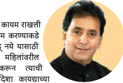
- अनिल देशमुख, गृह मंत्री

मुंबई शहरात १९८० च्या दशकात संघटित गुंड टोळ्यांनी डोके वर काढले, चाकू, सुरे वापरणाऱ्या दादा लोकांचा काळ तसा संपत आला असतानाच या संघटित गुंडांच्या टोळ्यांनी मोठा हैदोस घातला, मुंबई पोलीसांनी ((TADA) Terrorist and Disruptive Activities (Prevention) Act) त्यानंतर 'मोक्का' (महाराष्ट्र संघटित गुन्हेगारी प्रतिबंधक कायदा) सारख्या कडक कायदांची अंमलबजावणी करून या टोळ्यांचे कंबरडे मोडले. महाराष्ट्रात 'टाडा'ऐवजी 'मोक्का' म्हणजे 'महाराष्ट्र संघटित गुन्हेगारी प्रतिबंधक कायदा' २४ फेब्रुवारी १९९९ ला लागू करण्यात आला. संघटित गुन्हेगारीविरुद्ध 'मोक्का'सारखा कठोर कायदा करणारे महाराष्ट्र हे पहिले राज्य राज्य ठरले.