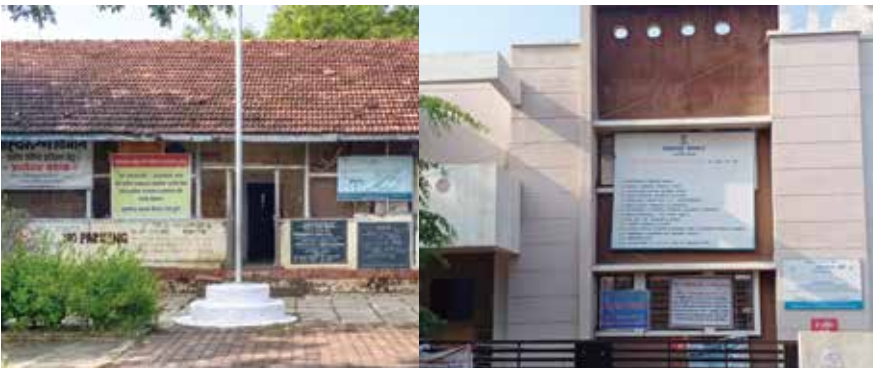
घोडनदी..शिरूर तालुक्यातील प्रा. आ. केंद्र ..जुने व नवीन