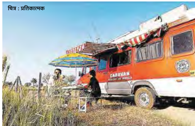
चित्र : प्रतिकाल्मक

या पर्यटन संकल्पनेमुळे पर्यटकांना राहण्याची सुविधा तसेच खासगी गुंतवणुकीसही प्रोत्साहन मिळेल. कौटुंबीक सहलीचे आयोजन, हॉटेल्स आणि रिसॉर्ट या पारंपरिक निवास व्यवस्थेपेक्षा वेगळा अनुभव, ना विकास क्षेत्राचा योग्य वापर, दुर्गम भागातील पर्यटनाला चालना देऊन रोजगाराची संधी उपलब्ध करून देणे यामुळे शक्य होणार आहे.