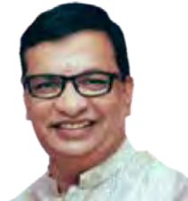
श्री. बाळासाहेब थोरात मा. महसूल मंत्री