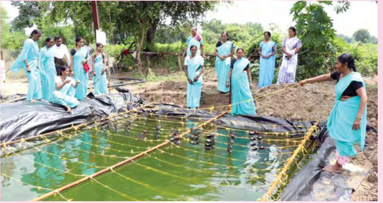
माविमच्या साहाय्याने महिलांचे आर्थिक व सामाजिक सक्षमीकरण.