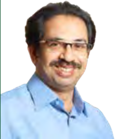
श्री. उद्धव ठाकरे मा. मुख्यमंत्री