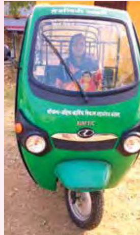
माविमच्या साहाय्याने भंडारा येथे ई-रिक्षा चालवणारी एक महिला

महिला व बालविकास विभागामार्फत अनेक महत्त्वाचे निर्णय घेतले आहेत. नव तेजस्विनी-महाराष्ट्र ग्रामीण महिला उद्यम विकास प्रकल्प हा ग्रामीण महिलांच्या उन्नत उपजीविकेकरिता मूलभूत बदलाचा कार्यक्रम दहा लाख कुटुंबापर्यंत पोहोचणार आहे. कोरोनाचा परिणाम साहजिकच विभागावर व लाभार्थींवर झालेला आहे. पण त्यातही आम्ही जास्तीत जास्त मदत करण्याचा प्रयत्न करत आहोत. अगदी पोषण आहार असेल तो घरपोच पोहोचण्याचा आमचा यशस्वी प्रयत्न झाला. त्याचप्रमाणे बालगृह, बालकांची सुरक्षा आणि त्यांची काळजी कोविड काळात समुपदेशनासाठी सुरू केलेला तरंग सुपोषित महाराष्ट्राचा हा डिजिटल प्लॅटफॉर्म, बालगृहाची नोंदणी, अनाथांसाठी प्रमाणपत्र, त्यांचे आरक्षण