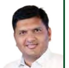
श्री. प्राजक्त तनपुरे मा. ऊर्जा राज्यमंत्री

अधिक माहितीसाठी महावितरणच्या www.mahadiscom.in या संकेतस्थळाला भेट द्यावी तसेच टोल फ्री क्र. १८००१०२३४३५ / १८००२३३४३५ / १९१२ यावर संपर्क साधावा.