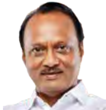
श्री. अजित पवार मा. उपमुख्यमंत्री