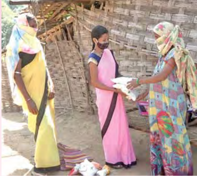
पोषण आहाराचे वाटप करताना सेविका.