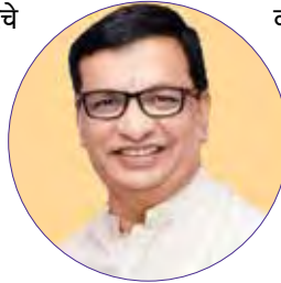
बाळासाहेब थोरात महसूल मंत्री

को रोनाच्या अभूतपूर्व संकटामुळे राज्य सरकारचे उत्पन्नाचे स्रोत घटले आहेत. केंद्र सरकारकडून राज्याला जीएसटीच्या परताव्यासह इतर निधीच्या रूपाने मिळणारा निधीही मिळत नसताना राज्य शासनाने आपल्या अर्थसंकल्पातून कृषी, आरोग्य, शिक्षण आणि विकास प्रकल्पांसह राज्यातील सर्व समाजघटक व विभागांसाठी भरीव निधीची तरतूद केली आहे.