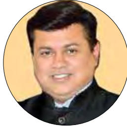
उदय सामंत उच्च व तंत्रशिक्षण मंत्री

उच्च व तंत्रशिक्षण विभागाच्या २७ फेब्रुवारी २००८ च्या शासन निर्णयानुसार मुंबई येथे आतंकवादी हल्ल्यात शहीद झालेल्या पोलिसांच्या व राज्य शासनाच्या इतर कर्मचाऱ्यांच्या कुटुंबीयांना मोफत शिक्षणाची सुविधा प्रदान करण्याबाबत आदेश निर्गमित करण्यात आलेले आहेत. यानुसार पात्र विद्यार्थ्यांना शिक्षण शुल्काची तसेच इतर शुल्काची प्रतिपूर्ती शासनमार्फत करण्यात येते. देशरक्षणासाठी शहीद झालेल्या शूर व्यक्तींच्या कुटुंबाविषयी सहानुभूती व्यक्त करताना त्यांच्या कुटुंबीयांना आर्थिक आधार तसेच योग्य दर्जाचे शिक्षण देण्याची सुविधा उपलब्ध करणे आवश्यक असल्यामुळे अशा शहिदांच्या पाल्यांना तांत्रिक व्यावसायिक पदवी आणि पदव्युत्तर पदवी अभ्यासक्रमासाठी खासगी विनाअनुदानित संस्थांमध्ये संस्थास्तरावरील जागांमध्ये प्राधान्य देण्याची तरतूद आहे. त्याचप्रमाणे महाराष्ट्र राज्याचे रहिवासी असलेल्या सीमेवर कार्यरत दहशतवादी हल्ल्यात शहीद झालेल्या लष्करी अथवा निमलष्करी जवानांच्या पाल्यांनादेखील या निर्णयाचा फायदा होणार आहे. शैक्षणिक वर्ष २०२०-२१ मध्ये व त्यानंतर होणाऱ्या प्रवेशाकरिता हे नियम लागू राहणार आहेत.