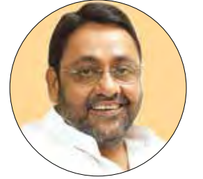
नवाब मलिक कौशल्य विकास, रोजगार व उद्योजकता मंत्री

केंद्र आणि राज्य शासनमार्फत कौशल्य विकासासाठी कोणकोणते अभ्यासक्रम, योजना राबवल्या जातात, याचा लाभ मिळवण्यासाठी कोठे संपर्क साधावा, महास्वयंम संकेतस्थळाद्वारे रोजगार कसा मिळवावा, अशा विविध प्रश्नांसंदर्भात माहिती देण्यासाठी राज्यातील सर्व जिल्ह्यांमधील ३५५ तालुक्यांमध्ये कौशल्य विकास रथाद्वारे जनजागृती केली जाणार आहे. याशिवाय कौशल्य प्रशिक्षण आणि रोजगाराच्या शोधात असलेल्या तरुणांचे समुपदेशनही यामार्फत केले जाणार असून यासाठी तयार करण्यात आलेल्या सात कौशल्य विकासस्थानांना झेंडी दाखवून कौशल्य विकास, रोजगार आणि उद्योजकता मंत्री नवाब मलिक यांनी या मोहीमेचा शुभारंभ केला. सोच मल्टिपर्पज सोसायटीमार्फत आणि महाराष्ट्र राज्य कौशल्य विकास सोसायटीच्या सहयोगातून हा उपक्रम राबवण्यात येत आहे. या वेळी रथांच्या शुभारंभाबरोबरच 'स्कील टु लाईव्हलीहूड कार्निव्हल' या उपक्रमाचाही शुभारंभ करण्यात आला.