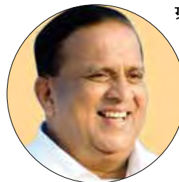
हसन मुश्रीफ ग्रामविकास मंत्री

राज्यातील ग्रामीण भागातील सुमारे ३,२०० स्केअर फुटापर्यंतच्या भूखंडावरील बांधकामांना आता नगररचनाकाराच्या परवानगीची गरज लागणार नाही, असे ग्रामविकास मंत्री हसन मुश्रीफ यांनी सांगितले.