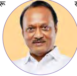
अजित पवार उपमुख्यमंत्री

अ र्थसंकल्प तयार करण्याची प्रक्रिया वर्षभर निरंतर सुरू असते. अर्थसंकल्प परिपूर्ण होण्यासाठी लोकप्रतिनिधींच्या सूचना महत्त्वाच्या ठरत असतात. राज्याचा उपमुख्यमंत्री तसेच वित्त व नियोजनमंत्री म्हणून राज्याचा दौरा करताना स्थानिक लोकप्रतिनिधी, नागरिकांना आवर्जून भेटलो. त्यांच्याकडून स्थानिक प्रश्न, जनतेच्या मागण्या, गरजा समजून घेतल्या. या मागण्यांचे, सूचनांचे, गरजांचे संकलन माझ्या कार्यालयात वर्षभर सुरू असते. विविध क्षेत्रात तळमळीने कार्य करणाऱ्या व्यक्ती, स्वयंसेवी संस्थांकडूनही वेगवेगळे विषय समोर येतात. यापैकी अनेक विषय राज्याच्या विकासाला नवी दिशा, गती देणारे असतात. यंदाच्या अर्थसंकल्पात अशा अनेक विषयांचे प्रतिबिंब आपल्याला दिसेल.