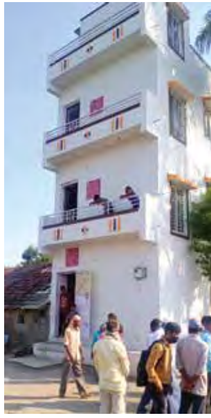
अपुन्या जागेत बहुमजली घरांची निर्मिती

अभियान कालावधीत नावीन्यपूर्ण उपक्रमाद्वारे पुरेशी जागा नसल्याने आतापर्यंत २५२ बहुमजली इमारतींचे बांधकाम पूर्ण झाले आहे. १०७ गृहसंकुलांची उभारणी केली आहे. महिला बचतगटांच्या सहभागाने १८८ 'घरकूल मार्ट'ची उभारणी करण्यात आली आहे. १२०५ घरकूल लाभार्थ्यांना बँकेचे गृहकर्ज देण्यात आले आहे. अंतर्गत रस्ते, मलनिस्सारण व्यवस्था, पथदिवे, सांडपाणी/घनकचरा व्यवस्थापन इ. मूलभूत सुविधांसह 'आदर्श घरांची' निर्मिती करण्यात आली आहे.