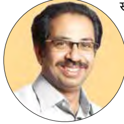
उद्धव बाळासाहेब ठाकरे मुख्यमंत्री