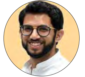
आदित्य ठाकरे पर्यटन मंत्री

राज्यातील 'नॉट वेटलँड' म्हणून पडताळणी झालेल्या साईट्सची पुन्हा पडताळणी करण्यात यावी, वेटलँड्सच्या जतन आणि संवर्धनाचा समावेश माझी वसुंधरा अभियानात करण्यात यावा. तसेच याबाबत संबंधित कर्मचाऱ्यांची विभागस्तरावर कार्यशाळा घेण्यात यावी, अशा सूचना पर्यावरण आणि वातावरणीय बदल मंत्री तथा महाराष्ट्र राज्य वेटलँड प्राधिकरणाचे अध्यक्ष आदित्य ठाकरे यांनी दिल्या.