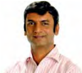
श्री. शंकरराव यशवंतराव गडाख मा. मंत्री, मृद व जलसंधारण