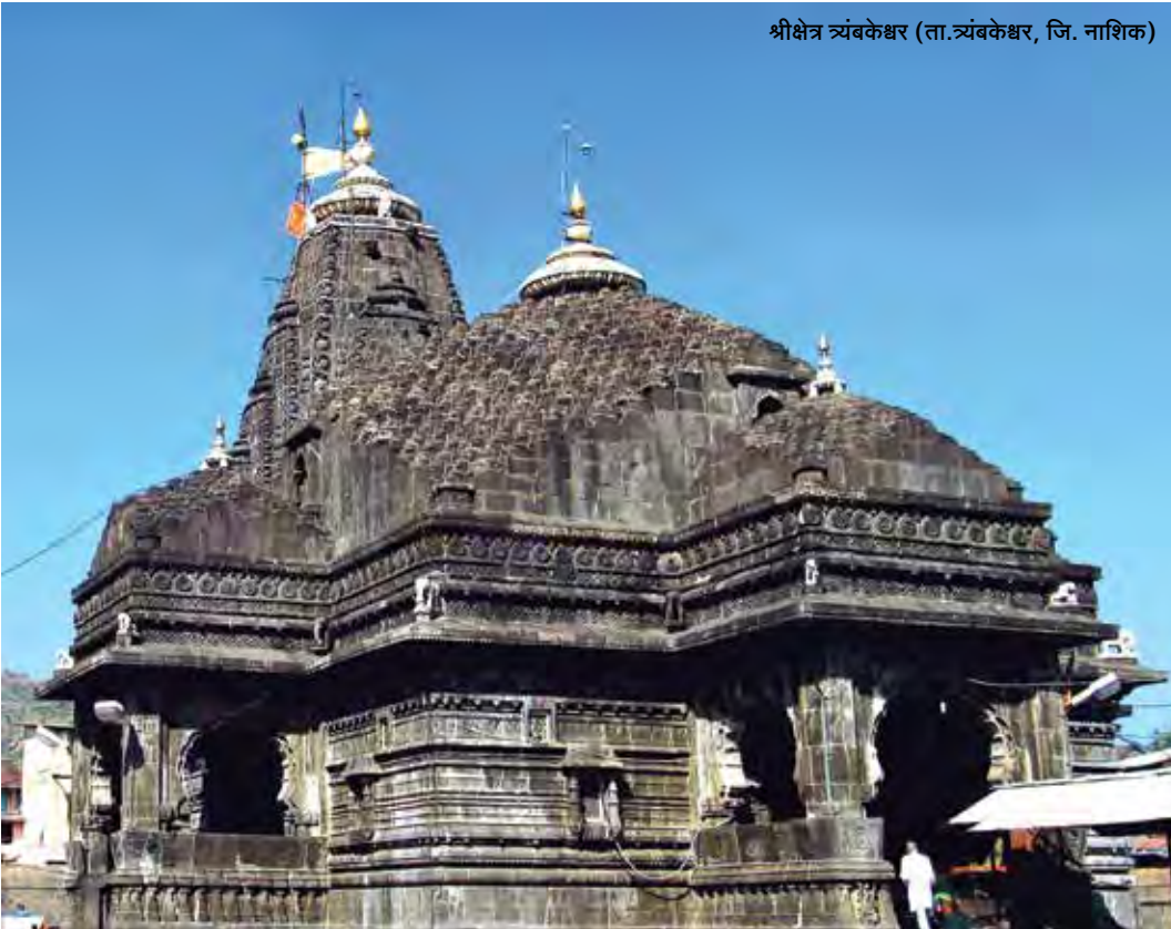
श्रीक्षेत्र त्र्यंबकेश्वर (ता.त्र्यंबकेश्वर, जि. नाशिक)