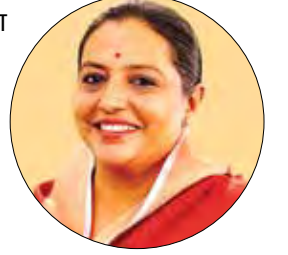
अॅड. यशोमती ठाकूर महिला व बालविकास मंत्री

करता येणार आहे. हे अॅप विनामुल्य असून महिलांना स्वच्छ आणि सुरक्षित प्रसाधनगृहांची उपलब्धता करून देणार आहे. सुरुवातीला शासकीय महिला अधिकारी-कर्मचाऱ्यांना हे अॅप विनामुल्य वापरता येणार असून सर्वसामान्य महिलांसाठी ९९ रुपये प्रतिमाह सबस्क्रिप्शन घेऊन वापर करता येणार आहे. हे अॅप गुगल प्ले स्टोरवर सहजरीत्या उपलब्ध करून देण्यात आले आहे. बुलू अॅपने प्रमाणित केलेल्या हॉटेलस आणि रेस्टॉरंटच्या प्रसाधनगृहांची यादी या अॅपमध्ये समाविष्ट करण्यात आली आहे.