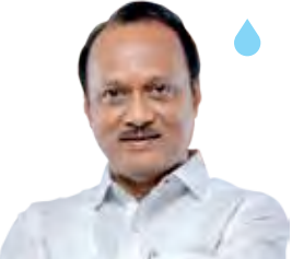
श्री. अजित पवार मा. उपमुख्यमंत्री