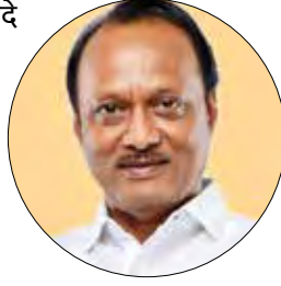
अजित पवार उपमुख्यमंत्री

देणे, रेशीम संचालनालयातील रिक्तपदे कंत्राटी पद्धतीने भरण्यास मान्यता देण्यासह, वस्त्रोद्योगासाठी सौरऊर्जेच्या वापराची शक्यता तपासणे आदींबाबत राज्य सरकार सकारात्मक असल्याची माहिती उपमुख्यमंत्री अजित पवार यांनी दिली.