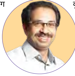
उद्धव बाळासाहेब ठाकरे मुख्यमंत्री

देशात कोरोना विषाणूच्या प्रादुर्भावामुळे संपूर्ण जग आणि देशाची अर्थव्यवस्था संकटात असताना महाराष्ट्रावरही त्याचा परिणाम जाणवणारच होता. संपूर्ण आर्थिक वर्षात जवळपास आठ महिने राज्याच्या स्थूलराज्य उत्पन्नात सर्वाधिक योगदान देणारी उद्योग आणि सेवा क्षेत्रासारखी महत्त्वाची क्षेत्रे टाळेबंदीमुळे बंद होती त्याचा परिणामही राज्य अर्थव्यवस्थेवर झाला असला तरी महाराष्ट्र कधीच थांबला नाही आणि थांबणारही नाही. टाळेबंदी उठवल्यानंतर महाराष्ट्राच्या अनेक क्षेत्रातील अर्थचक्र गतिमान झाले असून भविष्यात कोरोनाचे संकट कमी झाले तर महाराष्ट्र पुन्हा आपल्या सर्व सामर्थ्यानिशी भरारी घेईल, असा मला विश्वास वाटतो.