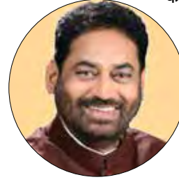
डॉ. नितीन राऊत

देशातील एक अग्रगण्य वीजनिर्मिती कंपनी म्हणून नावलौकिक असलेल्या महानिर्मितीने १०,४४५ मेगावॉट वीजनिर्मिती साध्य करून औष्णिक वीजनिर्मितीमध्ये एक नवा इतिहास रचला आहे. वीज निर्मितीमध्ये कोळसा व्यवस्थापन सर्वात महत्त्वाचे असते. ऊर्जा मंत्री डॉ. नितीन राऊत यांनी राज्यातील औष्णिक वीज केंद्राची उत्पादन क्षमता अर्थात प्लांट लोड फॅक्टर वाढवण्यावर लक्ष केंद्रित केले.