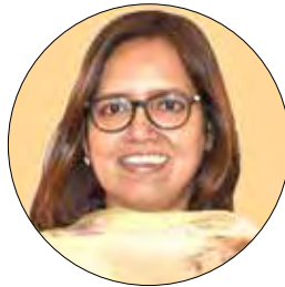
प्रा. वर्षा गायकवाड शालेय शिक्षण मंत्री

राज्यातील दहावी आणि बारावीच्या विद्यार्थ्यांच्या परीक्षा सुरक्षित वातावरणात घेण्याबरोबर व विद्यार्थ्यांचे शैक्षणिक वर्षाचे नुकसान होऊ नये, यासाठी शासन प्रयत्न करत आहे. यासाठी सर्वानी एकत्र येऊन राज्यभर समान स्तरावर ऑफलाईन पद्धतीने परीक्षा देण्यासाठी सज्ज होताना ('वी कॅन डू ईट ऑफलाईन एक्झाम')