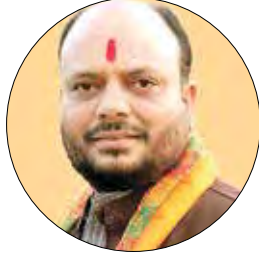
गुलाबराव पाटील पाणीपुरवठा व स्वच्छता मंत्री

उपाययोजना, भूजल पुनर्भरणाच्या विविध उपाययोजना, भूस्तर व जलधारक संरचना इत्यादी दर्शवणारे विविध मॉडेल्स प्रदर्शित केलेले आहेत. हे प्रदर्शन भूजल विज्ञान आणि भूजल दृष्टिकोनातून अत्यंत महत्त्वाचे असून विद्यार्थी आणि शासकीय कर्मचाऱ्यांनाही भूजलाचा अभ्यास करताना निश्चितच लाभ होणार आहे, अशी माहिती या वेळी देण्यात आली.