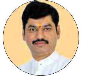
धनंजय मुंडे सामाजिक न्याय व विशेष साहाय्य मंत्री

सामाजिक न्याय विभागांतर्गत परदेशातील नामांकित विद्यापीठांमध्ये उच्च शिक्षण घेणाऱ्या विद्यार्थ्यांना देण्यात येणाऱ्या परदेश शिष्यवृत्ती योजनेच्या नियमात अंशतः बदल करण्यात आला असून, यानुसार आता योजनेचे लाभार्थी म्हणून निवड झालेल्या विद्यार्थ्यांनी काही कारणास्तव लाभ नाकारल्यास निवड सूचीतील प्रतिक्षा यादीतील पुढील पात्र विद्यार्थ्यांला परदेश शिष्यवृत्तीचा लाभ मिळू शकेल. याबाबतचा शासन निर्णय नुकताच निर्गमित करण्यात आला आहे, असे सामाजिक न्याय व विशेष साहाय्य मंत्री धनंजय मुंडे यांनी सांगितले.