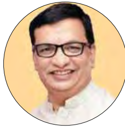
बाळासाहेब थोरात महसूल मंत्री

वाढत्या शहरीकरणामुळे घनकचरा व्यवस्थापनाची समस्या जटिल होत चालली आहे. महाराष्ट्रातील नगर परिषदा व नगर पंचायतींकडे घनकचरा व्यवस्थापनाकरिता स्वतःच्या मालकीची जागा नसल्याने अनेक शहरांचे विकास आराखडे रखडले आहेत. अशा शहरांत घनकचरा व्यवस्थापनासाठी जागा उपलब्ध