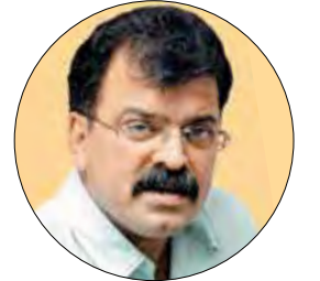
जितेंद्र आव्हाड गृहनिर्माण मंत्री

मुंबईमध्ये म्हाडाच्या ५६ वसाहती आहेत. त्याचप्रमाणे राज्यात अन्यत्र सुद्धा म्हाडाच्या मालकीच्या इमारती आहेत. या वसाहतींमधील इमारतींचा पुनर्विकास, संबंधित सहकारी गृहनिर्माण संस्था त्यांच्या स्तरावर विकासकाची नियुक्ती करून करतात. या भूखंडाची मालकी म्हाडाची आहे. तथापि, अशा भूखंडावरील सहकारी गृहनिर्माण संस्थांच्या पुनर्विकासाचे प्रस्ताव सहकारी गृहनिर्माण संस्थांकडून/संबंधित विकासकाकडून प्राप्त झाल्यानंतर केवळ ना हरकत प्रमाणपत्र देण्याबाबतची कार्यवाही म्हाडाकडून करण्यात येते. या पुनर्विकास प्रक्रियेवर म्हाडाचे कोणतेही नियंत्रण नव्हते. पुनर्विकासासंदर्भात केवळ संबंधित गृहनिर्माण संस्था व विकासक यांच्यामध्ये द्विपक्षीय करार झालेला असल्याने त्यामधील अटी व शर्ती यांचे उल्लंघन झाल्यास म्हाडाकडून