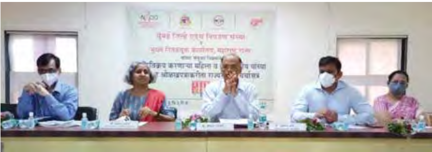
तृतीयपंथीय आणि देहविक्री व्यवसाय करणाऱ्या स्त्रिया यांच्यासाठी कार्य करणाऱ्या संस्थांसोबत चर्चासत्र.

१८ ते २१ वय असणाऱ्यांसाठी : १८ ते २१ या दरम्यान वय असेल आणि त्या व्यक्तीकडे वयाचे वरीलपैकी कोणतेही दस्तऐवज नसतील, तर त्या व्यक्तीच्या पालकाने त्या व्यक्तीचे वय अमुक आहे, असे लेखी प्रतिज्ञापत्र दिले तर ते ग्राह्य धरले जाते. किंवा तृतीयपंथीयांमध्ये गुरू पद्धत आहे. त्यांच्या गुरूंनी अर्ज क्रमांक ६ मध्ये दिलेले जोडपत्र दोन भरून दिले, तर तेही ग्राह्य धरले जाते. हे दोन्ही पर्याय शक्य नसल्यास अर्जदार ग्रामपंचायतीचे सरपंच, महानगरपालिका/नगरपालिका यांच्या