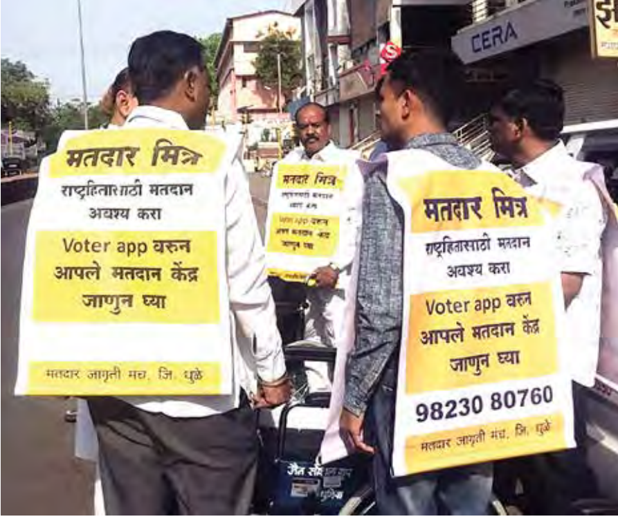
जनजागृती करताना 'मतदार मित्र' ..

यादी यांचे एकत्रीकरण करताना एका भागात राहणारे, एका सोसायटीत राहणारे, एका कुटुंबात राहणारे मतदार हे एकाच मतदान केंद्राच्या अधीनस्थ येतील, असे पाहिले जाते. तसेच, काही वेळा एखाद्या भागातील मतदार संख्या वाढली तर मतदान केंद्राची रचना बदलावी लागते. शहरांत एका मतदान केंद्रावर १५०० मतदारांचा समावेश होतो, तर ग्रामीण भागात १२०० मतदारांचा समावेश होतो.