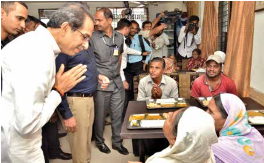
शिवभोजन थाळीचा लाभ घेणाऱ्या लाभार्थ्यांशी संवाद साधताना मुख्यमंत्री उद्धव ठाकरे.

हिमतीने इथवर आलो आहोत, कणखरपणे उभे राहून आपण जगासमोर संकटावर मात करण्यासाठी वाटा खुल्या केल्या. कोविड-१९चा मुकाबला चांगल्या पद्धतीने केल्याबद्दल देशात, जगात आपली प्रशंसा झाली. अर्थात आत्मसंतुष्ट न होता आपण आताही काळजीपूर्वक पण आत्मविश्वासाने पुढे जात आहोत. यापुढेही आपल्याला अशीच एकजूटीने खंबीरपणे, ठामपणे पावले टाकायची आहेत.