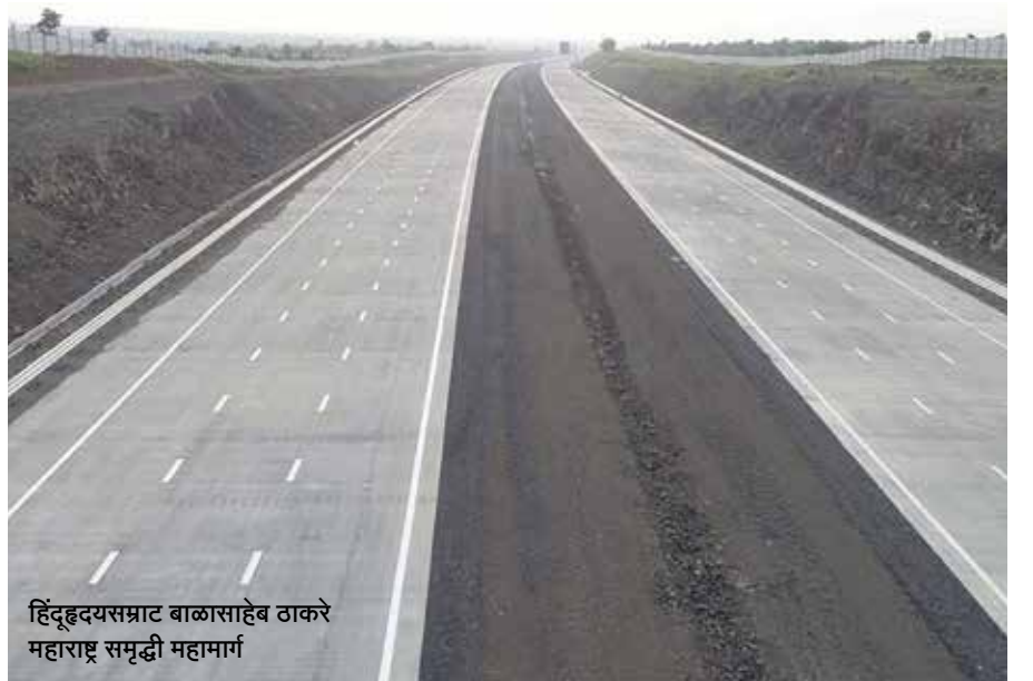
हिंदूहृदयसम्राट बाळासाहेब ठाकरे महाराष्ट्र समृद्धी महामार्ग

हिंदूहृदयसम्राट बाळासाहेब ठाकरे समृद्धी महामार्गही आपण लवकरच खुला करणार आहोत. राज्यात विविध शहरांना हवाई सेवेने जोडण्याचे नियोजन आहे. रस्ते, मेट्रोमार्ग यांचं इतके भक्कम आणि दर्जेदार जाळे राज्यात असणार आहे की, गतिमान महाराष्ट्राची नवीन ओळख त्यातून निर्माण होईल. देशाचे 'ग्रोथ इंजिन' असलेल्या मुंबईसारख्या महानगरात कोस्टल रोड, मुंबई ट्रान्स हार्बर लिंक व इतर मार्ग यामुळे मुंबई, ठाणे तसेच संपूर्ण महानगराच्या दळणवळण इतिहासात क्रांती झाल्याशिवाय राहणार नाही. मुंबईत सेवा क्षेत्र आणि राष्ट्रीय-आंतरराष्ट्रीय व्यापार केंद्राच्या दृष्टीने मुंबईत आंतरराष्ट्रीय दर्जाच्या परिवहन सुविधा उपलब्ध व्हाव्यात, असे प्रयत्न