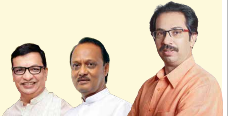
बाळासाहेब थोरात मंत्री महसूल