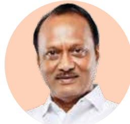
अजित पवार उपमुख्यमंत्री

राज्यातील आरोग्य सुविधा बळकट करण्यासाठी राज्य शासन विविध उपाययोजना राबवत आहे. या उपाययोजनांचा भाग म्हणून राज्यातील सर्व जिल्ह्यात आरोग्य विभागाच्या तत्सम योजनांना जिल्हा वार्षिक योजना (सर्वसाधारण) म्हणून राबवण्यास मान्यता देण्यात आली आहे. यामुळे नागरिकांना अधिक चांगल्या आरोग्य सुविधा पुरवणे शक्य होणार आहे. याबाबतचे शासन