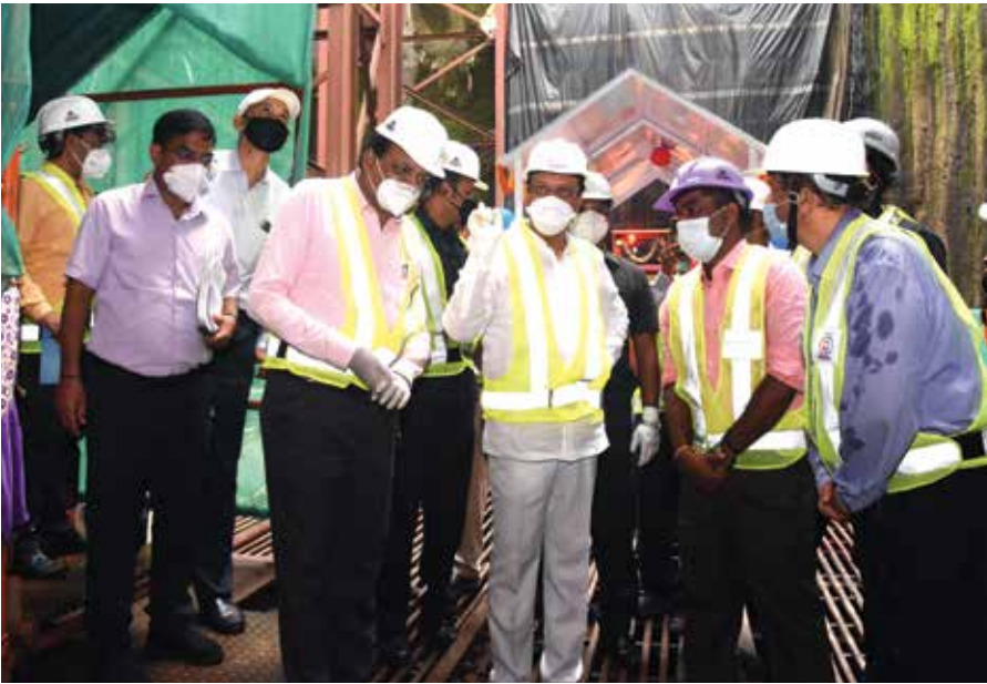
विकासकामांची पाहणी करताना उपमुख्यमंत्री अजित पवार

महाविकास आघाडीचे सरकार सत्तेवर आल्यानंतर महात्मा जोतिराव फुले शेतकरी कर्जमुक्ती योजना २०१९ची यशस्वी अंमलबजावणी केली. १ एप्रिल २०१५ ते ३१ मार्च २०१९ दरम्यान कर्ज घेतलेल्या व ३० सप्टेंबर २०१९ पर्यंत थकीत तसेच पुनर्गठण केलेल्या सर्व शेतकऱ्यांचे दोन