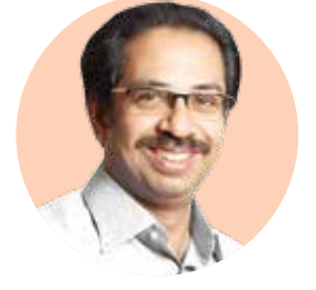
उद्धव बाळासाहेब ठाकरे मुख्यमंत्री