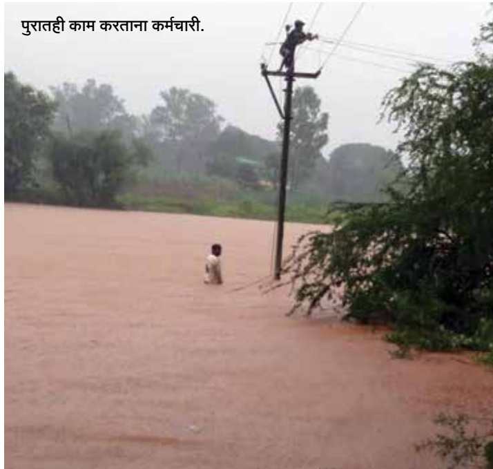
पुरातही काम करताना कर्मचारी.

तौक्ते चक्रीवादळामुळे १६ ते १८ मे २०२१ या कालावधीत सिंधुदुर्ग, रत्नागिरी, रायगड, व पालघर जिल्ह्यातील वीजवाहक