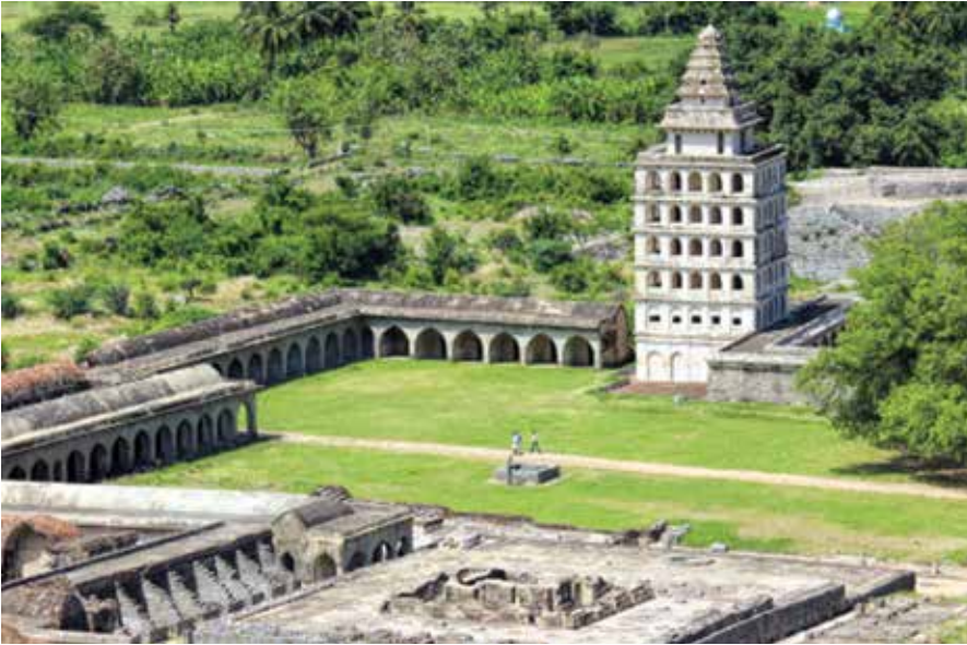
स्वराज्याची चौथी राजधानी असलेला तमिळनाडूमधील जिंजी किल्ला.

पंढरपूर येथे केंद्रीय रस्ते वाहतूक मंत्रालय, राष्ट्रीय महामार्ग प्राधिकरण व सार्वजनिक बांधकाम विभाग यांच्या संयुक्त विद्यमाने आयोजित १३ विविध महामार्ग प्रकल्पांच्या कामांचे भूमिपूजन व लोकार्पण प्रधानमंत्री नरेंद्र मोदी यांच्या हस्ते रिमोटचे बटण दाबून आभासी प्रणालीद्वारे करण्यात