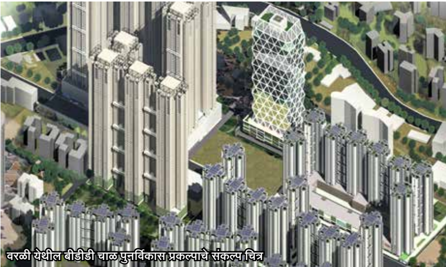
वरवी येथील बीडीडी चाळ पुनर्विकास प्रकल्पाचे संकल्प चित्र

बीडीडी चाळ पुनर्विकास प्रकल्प हा राज्य शासनाचा अत्यंत महत्वाकांक्षी प्रकल्प आहे. शासनाने या प्रकल्पाची अंमलबजावणी करण्यासाठी म्हाडाची सुकाणू अभिकरण म्हणून नियुक्ती केली आहे. चाळ पुनर्विकासात