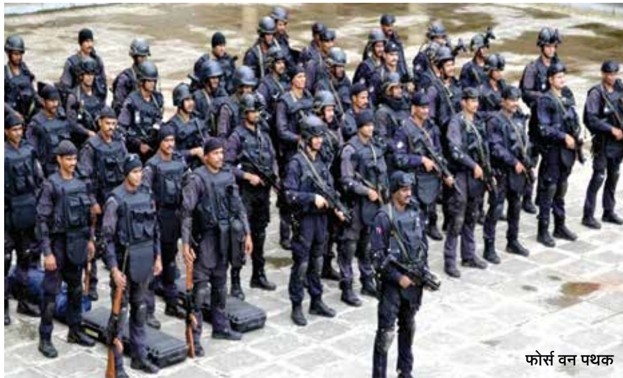
फोर्स वन पथक

नागरिकांच्या सुरक्षिततेला सर्वोच्च प्राधान्य देण्यासाठी राज्यात सीसीटीव्हीचा महत्त्वाकांक्षी कार्यक्रम राबवण्यात येत आहे.