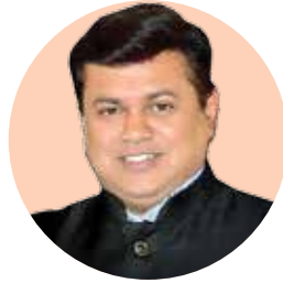
उदय सामंत उच्च व तंत्रशिक्षण मंत्री

उच्च व तंत्रशिक्षण मंत्री उदय सामंत म्हणाले, उच्च शिक्षण विभागांतर्गत प्राचार्य, शिक्षक व शिक्षकेतर पदांपैकी राज्याच्या उच्चस्तरीय सचिव समितीने एकूण ४,७३८ पदांना मान्यता दिली होती. त्यापैकी १,६७४ पदे भरण्यात आली. कोविड-१९ च्या प्रादुर्भावामुळे दीड ते दोन वर्षापासून भरतीवर राज्य शासनाने निर्बंध घातले होते. आजपर्यंतच्या ३७० प्राचार्यांची १०० टक्के रिक्त पदे भरण्यास २३ मार्च २०२१ रोजीच्या शासन निर्णयान्वये मान्यता दिली आहे. तसेच त्याबाबतची भरती प्रक्रिया सुरू झाली आहे. आता यापुढे प्राचार्यांची रिक्त होणारी पदे भरण्यास मंजुरी देण्यात आली आहे.