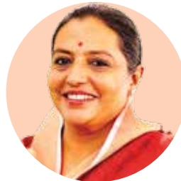
अॅड. यशोमती ठाकूर महिला व बालविकास मंत्री

महिला आर्थिक विकास महामंडळ, ई-बिझनेस प्लॅटफॉर्मद्वारे महिला सक्षमीकरणासाठी काम करत असून त्यासाठी बाजारपेठेतील संबंध विकसित करण्याचा प्रयत्न करत आहे. त्याच्या अनुषंगाने, वर्ल्ड एक्सपो, दुबई येथे 'माविम'ने एलबीआय जनरल ट्रेडिंग एलएलसी, बीबी ग्लोबल एफझेडई आणि सॅन बॅन बिझनेस कमर्शियल इन्व्हेस्टमेंट एलएलसीसोबत तीन सामंजस्य करारांवर स्वाक्षरी केली आहे, अशी माहिती महिला व बालविकास मंत्री अॅड. यशोमती ठाकूर