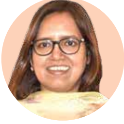
प्रा. वर्षा गायकवाड शालेय शिक्षण मंत्री

आदिवासी डीटीएड, बीएड (टीईटी/सीटीईटी) कृती समितीचे पदाधिकारी उपस्थित होते.