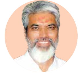
दादाजी भुसे कृषी, माजी सैनिक कल्याण मंत्री