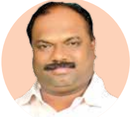
अॅड. अनिल परब परिवहन मंत्री

एसटी महामंडळाकडून कर्मचाऱ्यांनी विविध मागण्यासंदर्भात पुकारलेल्या संपाच्या पार्श्वभूमीवर एसटी कर्मचाऱ्यांच्या विविध मागण्यासंदर्भात महाराष्ट्र एसटी कर्मचारी संयुक्त कृती समितीने २७ ऑक्टोबरपासून बेमुदत उपोषण सुरू केले होते. कर्मचाऱ्यांच्या उपोषणाची दखल घेऊन