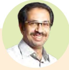
उद्धव ठाकरे मुख्यमंत्री

दिव्यांग व्यक्तींना राज्य व केंद्र सरकारच्या कोणत्याही योजनेचा लाभ घेण्यासाठी आवश्यक असलेली नोंदणी करून वैश्विक ओळखपत्र (युडीआयडी कार्ड) सहज रीतीने उपलब्ध व्हावे, यासाठी आरोग्य विभागाच्या समन्वयाने १२ डिसेंबर २०२१ पासून राज्यव्यापी मोहीम हाती घेतली, याद्वारे सुमारे एक लाख दिव्यांग व्यक्तींची नोंदणी पूर्ण झाली असून हे अभियान आणखी तीन महिन्यांसाठी सुरूच राहणार आहे. दिव्यांग व्यक्तींना विशेष साहाय्यक उपकरणे मोफत मिळावीत, यासाठी दानशूर