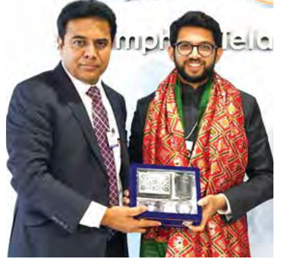
राज्य, राज्यातील नागरिक आणि अर्थातच राष्ट्राच्या उन्नतीच्या दृष्टीने महाराष्ट्र व तेलंगणा राज्य कसे परस्परपूरक चांगले काम करू शकतील, याबाबत झालेल्या चर्चेदरम्यान पर्यावरण मंत्री आदित्य ठाकरे यांचा सत्कार करताना तेलंगणाचे उद्योग तथा नगरविकास मंत्री केटी रामा राव.