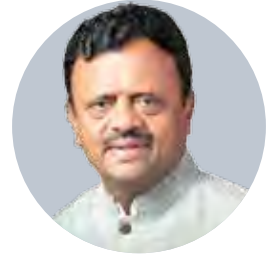
डॉ. राजेंद्र शिंगणे अन्न व औषध प्रशासन मंत्री

महा ऑर्गनिक अॅण्ड रेसिड्यू फ्री फार्मर्स असोसिएशन (मोर्फा) महाराष्ट्र राज्य पुणे यांच्यासमवेत सह्याद्री अतिथिगृह येथे सॅन्ड्रिय अणि विषमुक्त शेतीविषयक अन्न व औषध प्रशासन विभागाशी संबंधित विषयांवर चर्चा करण्यासाठी बैठक आयोजित करण्यात आली. जेष्ठ नेते आणि