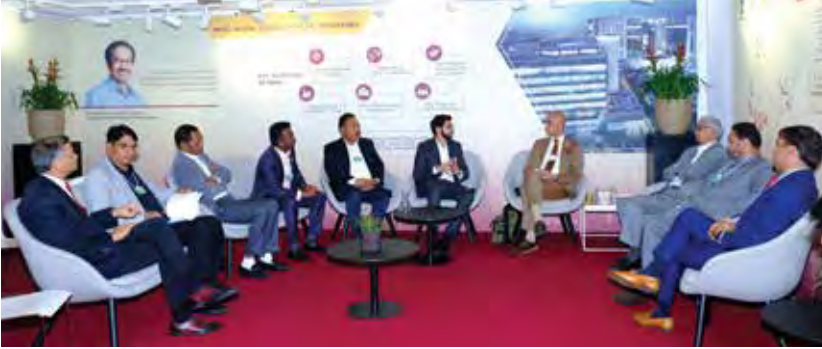
इलेक्ट्रिक वाहनांसाठी लागणाऱ्या बॅटरीसंबंधी, राज्यात इलेक्ट्रिक वाहनांसाठी चार्जिंग सुविधांबाबत अमरा राजा ग्रुपसोबत चर्चा.