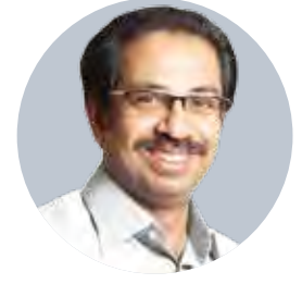
उद्धव बाळासाहेब ठाकरे मुख्यमंत्री