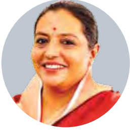
अॅड. यशोमती ठाकूर महिला व बालविकास मंत्री