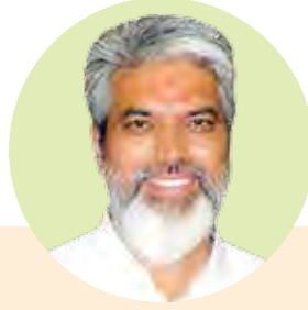
दादाजी भुसे कृषी मंत्री

राज्यातील शेतकरी बांधवांना दर्जेदार, प्रमाणित बियाणांचा पुरवठा करण्याबरोबर कोणत्याही शेतकरी बांधवांची तक्रार येणार नाही याची दक्षता घेतली आहे. बियाणे हा शेतीमध्ये शाश्वत उत्पादन व उत्पादकता वाढवण्यासाठीचा महत्त्वाचा घटक आहे. खरीप हंगामात खोडमाशीच्या प्रादुर्भावाची शक्यता गृहित धरून खोडमाशीचा प्रादुर्भाव रोखण्यासाठी उपाययोजना करण्याच्या सूचना दिल्या आहेत. हवामान खात्याच्या अंदाजानुसार यंदा पुरेसा पाऊस होणार आहे. परंतु पुरेसा पाऊस झाल्याशिवाय शेतकरी बांधवांनी पेरणी करू नये. २०२२-२३ हे वर्ष 'महिला शेतकरी व शेतमजूर सन्मान वर्ष' म्हणून घोषित केले आहे. कृषी विभागाच्या योजना ५० टक्के महिलांसाठी राखीव, महिलांसाठी ३० टक्के पूरक अनुदान व प्रचलित योजनेतून अभिसरणाद्वारे महिलांना लाभ देण्यात येत आहेत.