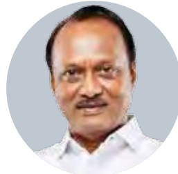
अजित पवार उपमुख्यमंत्री