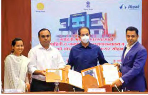
नवी मुंबईतील नेरुळ येथील माहिती भवन इमारत हस्तांतरणाचा सामंजस्य करार माहिती व जनसंपर्क महासंचालनालय आणि सिडको यांच्यात मुख्यमंत्री उद्धव ठाकरे यांच्या प्रमुख उपस्थितीत करण्यात आला.