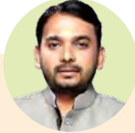
डॉ. विश्वजीत कदम कृषी राज्यमंत्री

प्रत्येक गावात शेतकऱ्यांच्या सभा घेऊन जमीन सुपिकता निर्देशांक आधारित संतुलित खत वापर विशेष मोहिमेंतर्गत ग्रामपंचायतीमध्ये प्रदर्शित केलेल्या जमीन सुपिकता निर्देशांक फलक आधारित खत वापराबाबत जनजागृती करण्यात येत आहे. खतांच्या विविध संयोजन पर्यायाकरिता शेतकऱ्यांच्या मोबाईलमध्ये कृषिक अॅप डाऊनलोड करून त्याच्या वापराबाबत मार्गदर्शन करण्यात येत आहे.