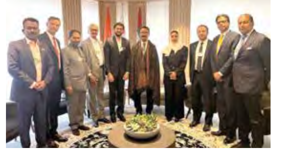
राज्याच्या ७२० कि.मी. समुद्रकिनार्यालागत बंदरांवरील पायाभूत सुविधांच्या विकासाबाबत 'डीपी वर्ल्ड यूएई' च्या मुख्य कार्यकारी अधिकाऱ्यांसोबत चर्चा.