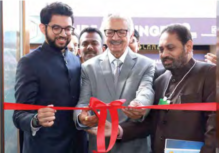
जागतिक आर्थिक परिषदेत दावोस येथे महाराष्ट्र दालनाचे उद्घाटन करताना उद्योगमंत्री सुभाष देसाई, पर्यावरण मंत्री आदित्य ठाकरे व ऊर्जामंत्री डॉ. नितीन राऊत.