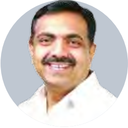
जयंत पाटील जलसंपदा मंत्री

घाटघर उदंचन जलविद्युत प्रकल्पग्रस्तांच्या समस्यांबाबत आज जलसंपदा मंत्री जयंत पाटील यांच्या अध्यक्षतेखाली बैठक झाली. त्या वेळी त्यांनी या सूचना दिल्या. सारंगपूरी, खैरे, साठगांव, शिलोत्तर, शिवनेरी, धसई येथील डावातीर कालवा प्रकल्पांवरही चर्चा करण्यात आली.