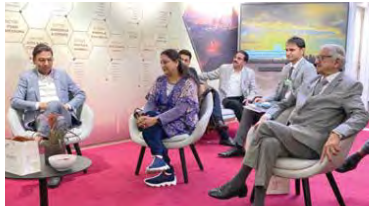
राज्यात उद्योग उभा करण्याबाबत जेमिनी कॉर्पोरेशनच्या शिष्टमंडळासोबत चर्चा.