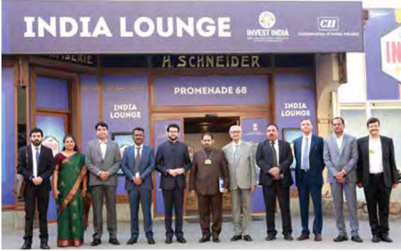
जागतिक आर्थिक परिषदेत इंडिया लाऊंजसमोर राज्यातील सहभागी मंत्रिगण व अधिकारी.