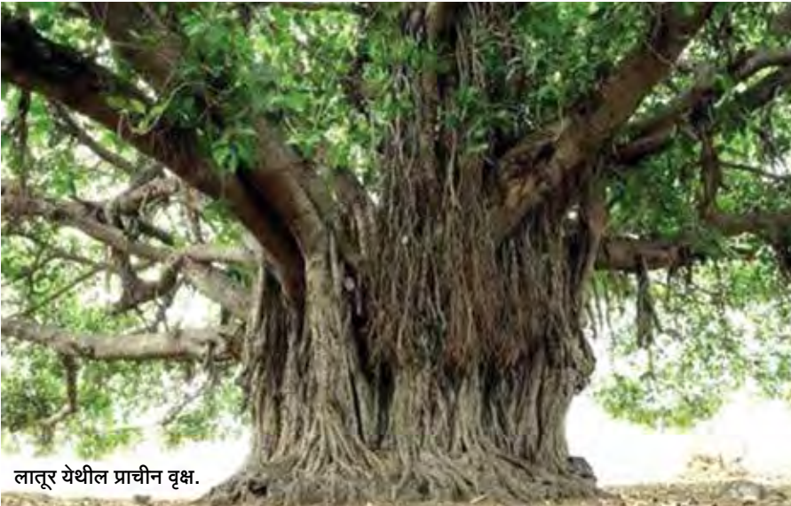
लातूर येथील प्राचीन वृक्ष.

ईव्हीच्या खरेदीवर प्रोत्साहन तसेच त्यांना रस्ते करामधून सूट देण्यात आली आहे. याचप्रमाणे चार्जिंग पायाभूत सुविधा निर्माण करण्याकरितादेखील प्रोत्साहन देण्यात येत आहे. यामध्ये मंदगती चार्जिंग स्टेशनला महत्तम दहा हजार, तर मध्यम किंवा वेगवान चार्जिंग स्टेशनला पाच लाख एवढे महत्तम प्रोत्साहन देण्यात येणार आहे. शासनाने महावितरण कंपनीस चार्जिंग सुविधा पुरवण्यासाठी राज्य नोडल एजन्सी म्हणून नियुक्त केले आहे. या चार्जिंग