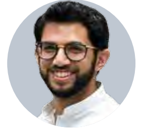
आदित्य ठाकरे पर्यटन, पर्यावरण व वातावरणीय बदल मंत्री

महाराष्ट्र पर्यटन विकास महामंडळाच्या ताब्यातील शासकीय जमिनीचा खासगीकरणाच्या माध्यमातून पर्यटनदृष्ट्या विकास करण्याचा शासनाचा प्रयत्न आहे. याअंतर्गत महाबळेश्वर, माथेरान, मिठबाव, हरिहरेश्वर आणि ताडोबा येथे निवास सुविधा उपलब्ध करून देण्यासाठी खासगी