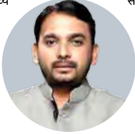
डॉ. विश्वजीत कदम

राज्यात नोव्हेंबर २०१९ मध्ये महाविकास आघाडीचे सरकार आल्यानंतर सामाजिक न्यायाच्या योजना, निर्णय-उपक्रमांवर विशेष लक्ष दिले आहे. परदेश शिष्यवृत्ती योजना, स्वाधार, ज्येष्ठ नागरिक, ऊसतोड कामगार, सफाई कामगार, तृतीयपंथीयांसाठी महामंडळ, सामाजिक समता कार्यक्रमाबरोबर बार्टीच्या माध्यमातून विविध प्रशिक्षण, उपक्रम शासन राबवत आहे.