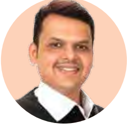
देवेंद्र फडणवीस उपमुख्यमंत्री

आणि कृषिपंपाचा अनुशेष दूर करताना सौर ऊर्जेला प्राधान्य देत, मार्च २०२२ पर्यंतचे संपूर्ण उद्दिष्ट पुढच्या सहा महिन्यात पूर्ण करावेत, यासाठी केंद्र सरकारची 'कुसुम' योजना आणि शासनाची योजना अशा दोन्ही योजनांचा वापर करत अधिकाधिक शेतकऱ्यांना लाभ मिळवून द्यावा, असे निर्देश उपमुख्यमंत्री श्री. फडणवीस यांनी दिले.