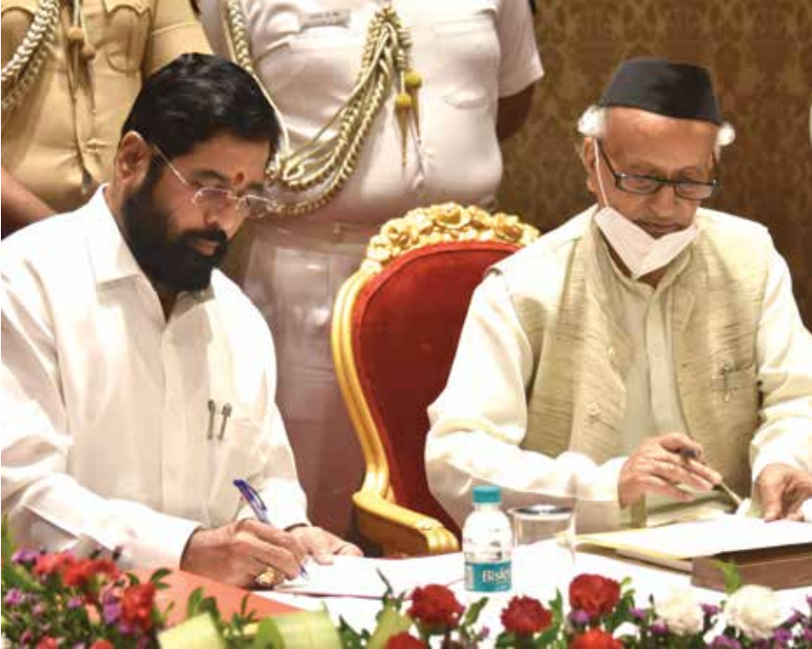
शपथविधी कार्यक्रमादरम्यान राज्यपाल भगतसिंह कोश्यारी आणि मुख्यमंत्री एकनाथ शिंदे.

मुख्यमंत्रिपदावरून जनतेची सेवा करण्याची संधी मला मिळाली असून त्यांच्या विश्वासाला तडा जाऊ न देता सर्वांना विश्वासात घेऊन राज्याची पुढची वाटचाल करणार असल्याचे सांगून श्री.शिंदे म्हणाले की, राज्यातील प्रगतिपथावर असलेल्या प्रकल्पांना अधिक गती देण्यात येईल. कोकण, पश्चिम महाराष्ट्र, विदर्भ, मराठवाडा, खानदेश अशा राज्याच्या सर्वच भागांचा विकास करण्यासाठी सरकार कटिबद्ध असल्याचेही मुख्यमंत्र्यांनी या वेळी सांगितले. हिंदुहृदयसम्राट बाळासाहेब ठाकरे यांची हिंदुत्वाची भूमिका व राज्याचा विकास या अर्जेड्यावर राज्याची पुढील वाटचाल असेल, असेही श्री.शिंदे पुढे म्हणाले. मंत्रिमंडळाच्या बैठकीत पीक-पाणी, जलयुक्त शिवार, मेट्रो प्रकल्प आदी विषयांवर चर्चा झाल्याचे त्यांनी या वेळी सांगितले. समृद्धी महामार्ग राज्याचा गेमचेंजर प्रकल्प ठरणार असल्याचे सांगून