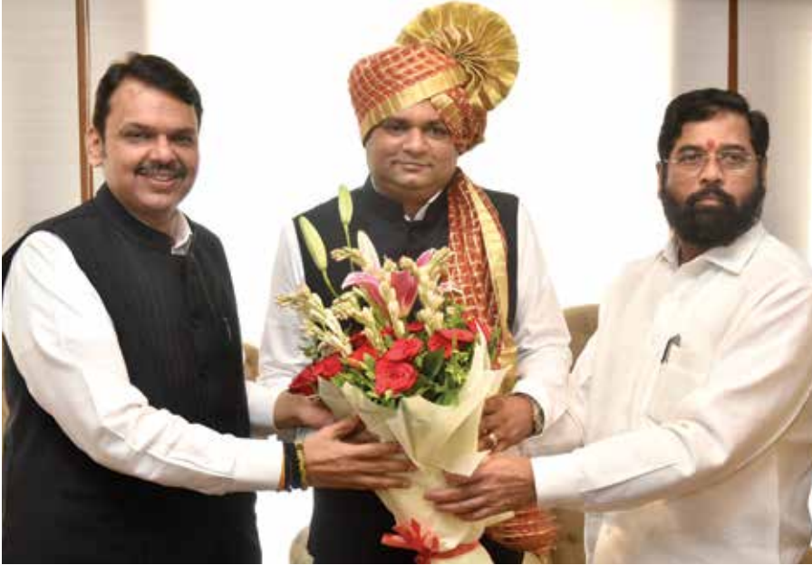
विधानसभा अध्यक्षपदी अॅड. राहुल नावेंकर यांची निवड झाल्याबद्दल अभिनंदन करताना मुख्यमंत्री एकनाथ शिंदे आणि उपमुख्यमंत्री देवेंद्र फडणवीस.

राज्याच्या सर्व नागरिकांचे प्रश्न सोडवण्याची संधी त्यांना मिळाली असून कोणत्याही अडचणी, प्रश्न सोडवण्याची क्षमता या सभागृहात आहे. त्यामुळे दोन्ही बाजू समजून घेऊन त्या विषयाला न्याय देण्याचे कार्य करतील, अशी अपेक्षा व्यक्त करून अॅड. राहुल नावेंकर यांची अध्यक्षपदी निवड झाल्याबद्दल श्री.फडणवीस यांनी नवनियुक्त विधानसभा अध्यक्षांचे अभिनंदन केले.