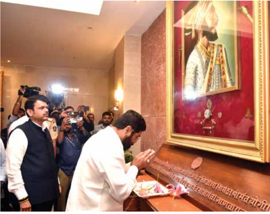
पदाची शपथ घेतल्यानंतर मुख्यमंत्री एकनाथ शिंदे व उपमुख्यमंत्री देवेंद्र फडणवीस यांनी मंत्रालयातील छत्रपती शिवाजी महाराज आणि भारतरत्न डॉ. बाबासाहेब आंबेडकर यांच्या प्रतिमेस अभिवादन केले.