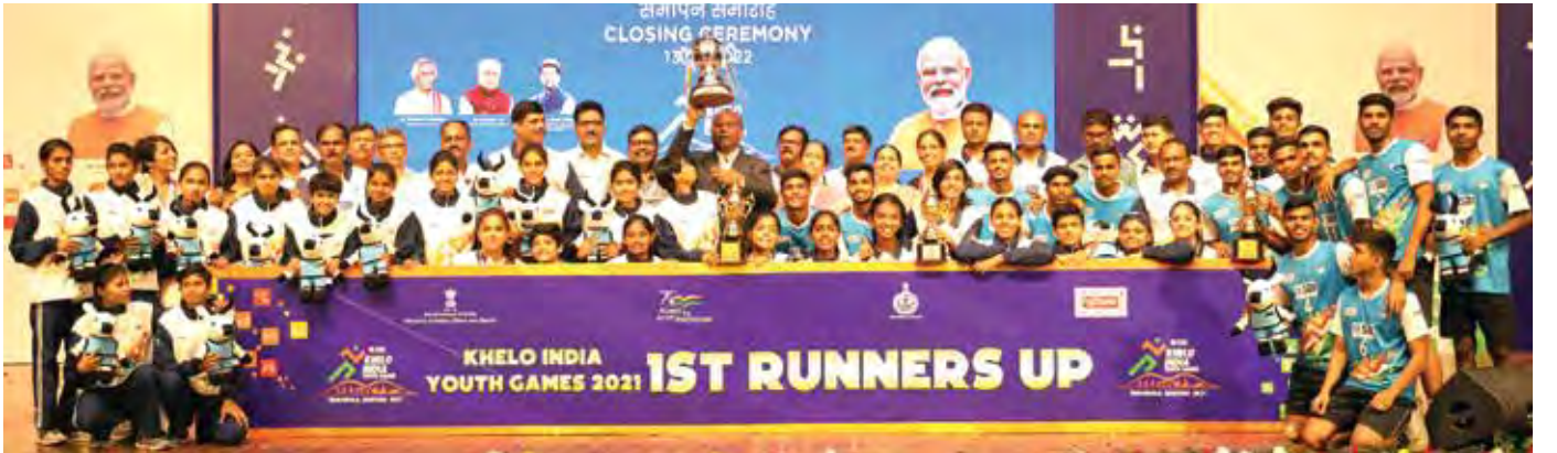
हरियाणातील पंचकुला येथे आयोजित तिसऱ्या खेलो इंडिया युथ गेम्स २०२१ मधील विजयाचे शिलेदार.

पुढील काळात लष्करासोबत सामंजस्य करार करून तेथील प्रशिक्षक उपलब्ध करून देण्यासाठी प्रयत्न करण्यात येणार असून पदकांच्या रकमेत लाखो रुपयांनी वाढ करण्यात आली आहे. सुवर्णपदकासाठी तीन लाख, रौप्यसाठी दोन लाख आणि कांस्य पदकासाठी एक लाख रुपयांची घोषणा करण्यात आली आहे. त्याचसोबत स्पर्धेतील सहभागी खेळाडूंना प्रोत्साहन म्हणून २५,००० रुपये रोख पारितोषिक देण्याचेदेखील शासनाने मान्य केले आहे.