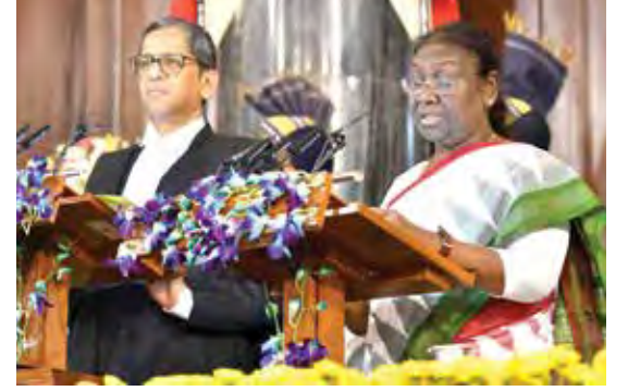
राष्ट्रपती पद व गोपनीयतेची शपथ घेताना श्रीमती द्रौपदी मुर्मू, त्यांना शपथ देताना देशाचे सरन्यायाधीश एन. व्ही. रमणा.

सर्वोच्च न्यायालयाचे सरन्यायाधीश एन. व्ही. रमणा यांनी श्रीमती मुर्मू यांना पद व गोपनीयतेची शपथ दिली. संसदेच्या सेंट्रल हॉलमध्ये झालेल्या या समारंभास माजी राष्ट्रपती रामनाथ कोविंद, उपराष्ट्रपती तथा राज्यसभेचे सभापती एम. व्यंकय्या नायडू, लोकसभा अध्यक्ष ओम बिर्ला, प्रधानमंत्री नरेंद्र मोदी यांच्यासह केंद्रीय मंत्री व विविध राज्यांचे मुख्यमंत्री, उपमुख्यमंत्री आदी मान्यवर उपस्थित होते. महाराष्ट्राचे मुख्यमंत्री एकनाथ शिंदे आणि उपमुख्यमंत्री देवेंद्र फडणवीस या समारंभास उपस्थित होते.