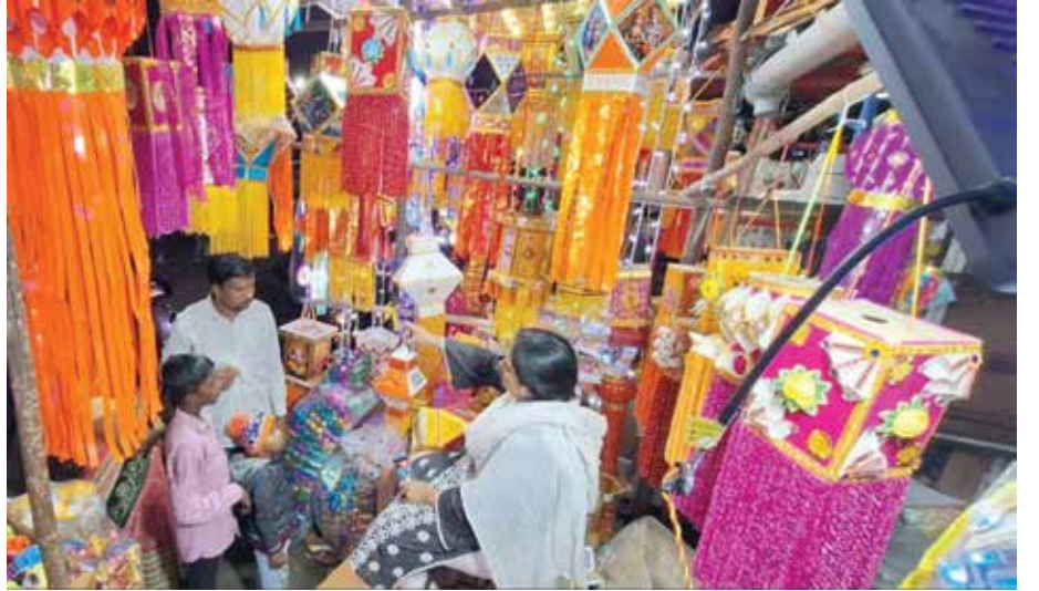
सांगली दिवाळीसाठी बाजारपेठेत होणारी मोठी उलाढाल.

गेल्या ५० ते ६० वर्षांत दिवाळीचे स्वरूप खूपच बदलले आहे. फराळाचे परंपरागत पदार्थ अजूनही कायम आहेत; परंतु त्यामध्ये